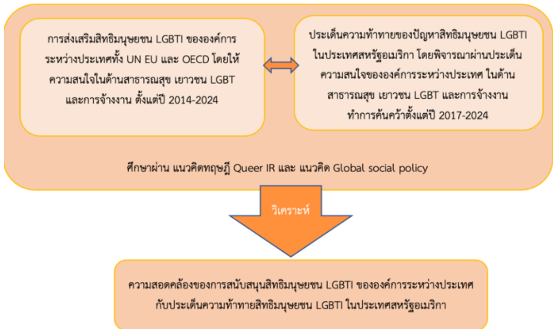
ภาพประกอบ 1 กรอบแนวคิด