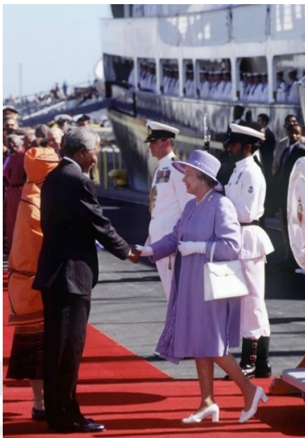
ภาพประกอบ 13 สมเด็จพระราชินีนาถเอลิซาเบธที่ 2 ทักทายประธานาธิบดีเนลสัน แมนเดลาแห่งแอฟริกาใต้ ในปี 1995