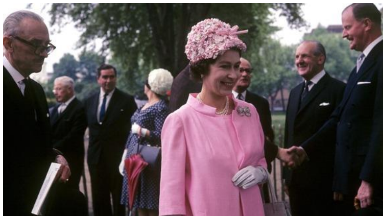
ภาพประกอบ 8 สมเด็จพระราชินีนาถเอลิซาเบธที่ 2 ในงานเลี้ยงฉลองสวนของ โรงพยาบาลรอยัล เซลซีในปี 1967