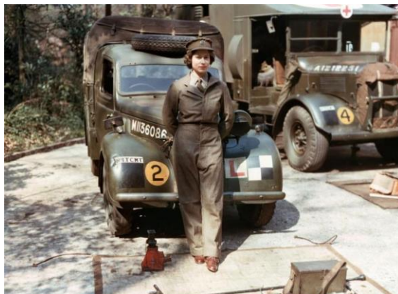
ภาพประกอบ 3 เจ้าหญิงเอลิซาเบธทรงสวมเครื่องแบบ ATS

ที่มา : Australian War Memorial. (2022). Queen Elizabeth II and the Second World War. https://www.awm.gov.au/articles/blog/queen-elizabeth-ii-and-the-second-world-war