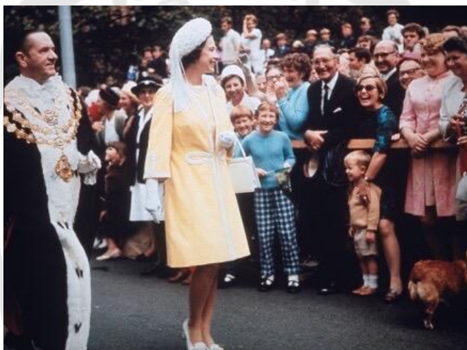
ภาพประกอบ 10 สมเด็จพระราชินีนาถเอลิซาเบธที่ 2 เสด็จเยือนออสเตรเลียและนิวซีแลนด์ในปี 1970

ที่ทำจากวัสดุชั้นดี ซึ่งช่วยเสริมให้พระองค์ดูสง่างามและมีเกียรติยิ่งขึ้น (Royal Collection Trust, 2024) โดยการเลือกใช้เครื่องประดับเหล่านี้ไม่เพียงแต่เพิ่มความสง่างามให้กับการแต่งกายของพระองค์ แต่ยังสะท้อนถึงความเป็นผู้นำและความน่าเคารพ การใช้เครื่องประดับในทศวรรษนี้มีความละเอียดอ่อนและมีความซับซ้อนมากขึ้น เมื่อเทียบกับทศวรรษ 1960 ที่เน้นความเรียบง่ายและความสง่างาม ในขณะที่ทศวรรษ 1980 จะเน้นความหรูหราและการตกแต่งที่มีความซับซ้อนมากขึ้น (Charles Taylor, 2020) การเลือกใช้เครื่องประดับของสมเด็จพระราชินีนาถเอลิซาเบธที่ 2 ในทศวรรษ 1970 จึงเป็นการผสมผสานระหว่างความหรูหราและความหมายเชิงสัญลักษณ์ที่สร้างความโดดเด่นและความน่าจดจำ