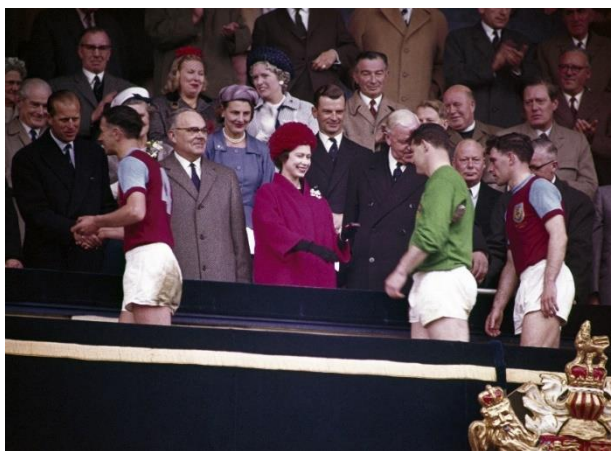
ภาพประกอบ 9 สมเด็จพระราชินีนาถเอลิซาเบธที่ 2 ในการแข่งขัน FA CUP รอบชิงชนะเลิศ ที่สนามเวมบลีย์ กรุงลอนดอน ในปี 1962