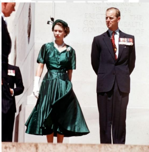
ภาพประกอบ 6 ชุดสมเด็จพระราชินีนาถเอลิซาเบธที่ 2 เสด็จเยือนออสเตรเลียอย่างเป็นทางการในปี 1954

เป็นทางการ ผลงานของเอ็มส์ช่วยเสริมสร้างภาพลักษณ์ของสมเด็จพระราชินีนาถเอลิซาเบธที่ 2 ให้ดูสง่างามและมีความร่วมสมัย (Angela Kelly, 2019) โดยการออกแบบของเอ็มส์มักเน้นการใช้ผ้าที่มีคุณภาพสูงและการตกแต่งที่ประณีต เช่น การใช้ลูกไม้และการปักลวดลาย ชุดที่ออกแบบโดยเอ็มส์มักมีความหลากหลายและเหมาะสมกับโอกาสต่าง ๆ การผสมผสานระหว่างความดั้งเดิมและความทันสมัยในผลงานของเอ็มส์ช่วยให้สมเด็จพระราชินีนาถเอลิซาเบธที่ 2 ดูโดดเด่นและมีความเป็นเอกลักษณ์ในทุกโอกาส (Colin McDowell, 2006)