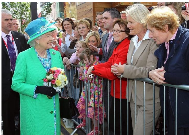
ภาพประกอบ 14 สมเด็จพระราชินีนาถเอลิซาเบธที่ 2 เสด็จเยือนเมืองคอร์ก ประเทศไอร์แลนด์ ในวันที่ 20 พฤษภาคม 2011 ที่เมืองคอร์ก