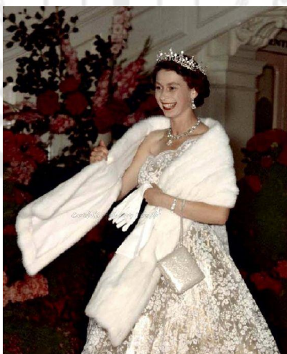
ภาพประกอบ 7 สมเด็จพระราชินีนาถเอลิซาเบธที่ 2 ในงานเลี้ยง ณ พระราชวังพอร์ตแลนด์ในปี 1954

นักออกแบบเสื้อผ้าของสมเด็จพระราชินีนาถเอลิซาเบธที่ 2 ในช่วงทศวรรษ 1950 มีบทบาทสำคัญในการกำหนดแนวทางการแต่งกายของพระองค์ นอร์แมน ฮาร์ตเนลล์ เซอร์ ฮาร์ดี เอมส์ และโมลลี่ แพร์นีส ต่างมีบทบาทในการสร้างสรรค์เสื้อผ้าที่สง่างามและเหมาะสมกับบทบาทของพระองค์ ผลงานของพวกเขาไม่เพียงแต่แสดงถึงความเชี่ยวชาญในการออกแบบและการตัดเย็บ แต่ยังสะท้อนถึงความสามารถในการผสมผสานระหว่างความดั้งเดิมและความทันสมัยได้อย่างลงตัว การออกแบบเสื้อผ้าของพวกเขาช่วยเสริมสร้างภาพลักษณ์ของสมเด็จพระราชินีนาถเอลิซาเบธที่ 2 ให้เป็นที่จดจำและเป็นที่ยอมรับในฐานะการก้าวขึ้นมาเป็นประมุขในระดับสากล