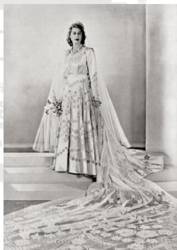
ภาพประกอบ 4 ชุดอภิเษกสมรสสมเด็จพระราชินีนาถเอลิซาเบธที่ 2

นอร์แมน ฮาร์ตเนลล์ ช่างตัดเสื้อราชสำนักได้รับการแต่งตั้งให้ออกแบบชุดแต่งงาน เขาได้รับแรงบันดาลใจจากภาพวาด "Primavera" ของ Botticelli ซึ่งเป็นสัญลักษณ์ของการเกิดใหม่และการฟื้นฟูของอังกฤษหลังสงคราม ชุดแต่งงานทำจากผ้าไหมซาตินสีงาช้าง ซึ่งได้มาผ่านช่องทางการทูตจากประเทศจีน เนื่องจากอังกฤษยังคงอยู่ภายใต้การปันส่วน ชุดนี้มีตัวเสื้อที่กระชับ คอเสื้อรูปหัวใจ และกระโปรงเต็มที่ยาว 13 ฟุต (4 เมตร) ชุดนี้ประดับด้วยพวงมาลัยดอกไม้ที่ปักอย่างละเอียด สัญลักษณ์ของการเติบโตและการเริ่มต้นใหม่ (D. Blum, 2017)