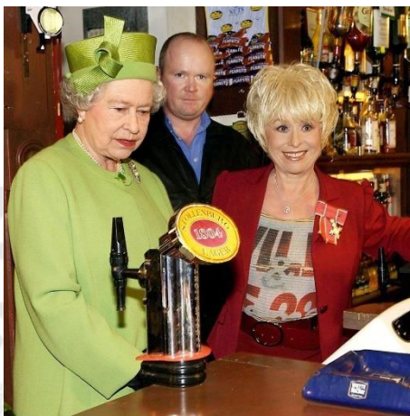
ภาพประกอบ 12 สมเด็จพระราชินีนาถเอลิซาเบธที่ 2 ในระหว่างการเสด็จเยือน Elstree Studios ปี 2001

ในฝูงชน ทำให้สามารถมองเห็นได้ง่ายแม้จะอยู่ในระยะไกล ซึ่งจำเป็นสำหรับงานสาธารณะจำนวนมากของพระองค์ นอกจากนี้ สีสดใสเหล่านี้ยังสื่อถึงความหวังและเสถียรภาพ ซึ่งเป็นคุณลักษณะที่สำคัญสำหรับผู้นำในช่วงทศวรรษที่มีการเปลี่ยนแปลงมากมาย (Sarah Bradford, 2012a)