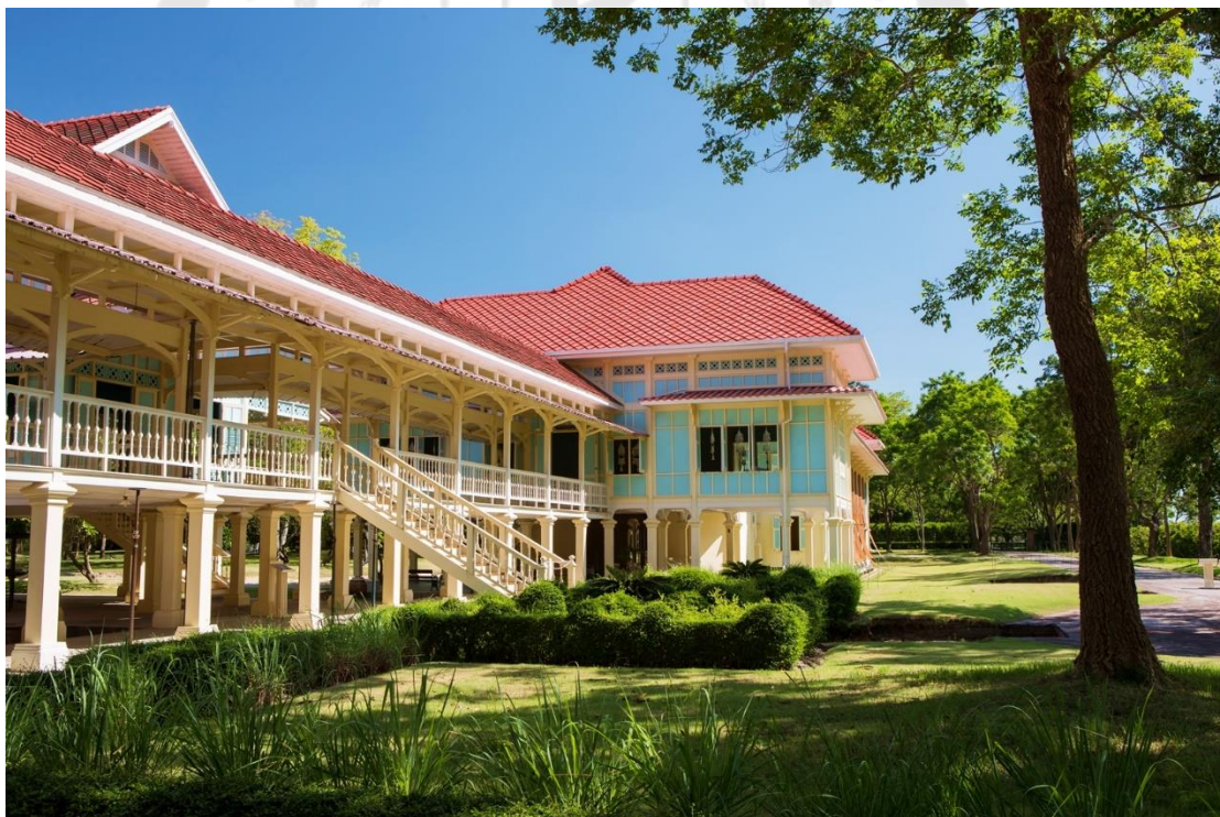
ภาพประกอบ 8 พระราชินีเวศน์มฤคทายวัน

พระราชินีเวศน์มฤคทายวัน เปิดให้เข้าชมวันจันทร์-วันศุกร์ ตั้งแต่เวลา 08.00-16.00 น. วันเสาร์-อาทิตย์และวันหยุดราชการ ตั้งแต่เวลา 08.30-16.00 น. ปิดวันพุธ ค่าเข้าชมผู้ใหญ่ 30 บาท เด็ก 15 บาท ชาวต่างประเทศ 30 บาท สำหรับผู้เข้าชมเป็นหมู่คณะ ต้องทำหนังสือถึงผู้กำกับการกองบังคับการฝึกพิเศษ (การท่องเที่ยวแห่งประเทศไทย)