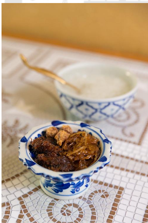
ภาพประกอบ 16 ข้าวแช่เมืองเพชร

ข้าวแช่ต้นตำรับเมืองเพชร จะมาพร้อมเครื่องเคียงเพียง 3 อย่างเท่านั้น คือ “ลูกกะปิ” ที่มีส่วนผสมของตะไคร้ กระจ่าง กะปิดี น้ำตาลโตนด ปลากระเทียม หัวหอม กระเทียม รากผักชี เมล็ดพริกไทย และเนื้อกุ้งสดโขลกเข้าด้วยกันแล้วชุบแป้งทอด “ไชโป๊ผัดหวาน” จากการนำผักกาดเค็มลงผัดในกระทะจนเหนียว และ “ปลากระเบนผัดหวาน” ที่ได้จากปลากระเบนตากแดดมายีให้เป็นฝอยแล้วผัดลงในกระทะจนเข้ากัน