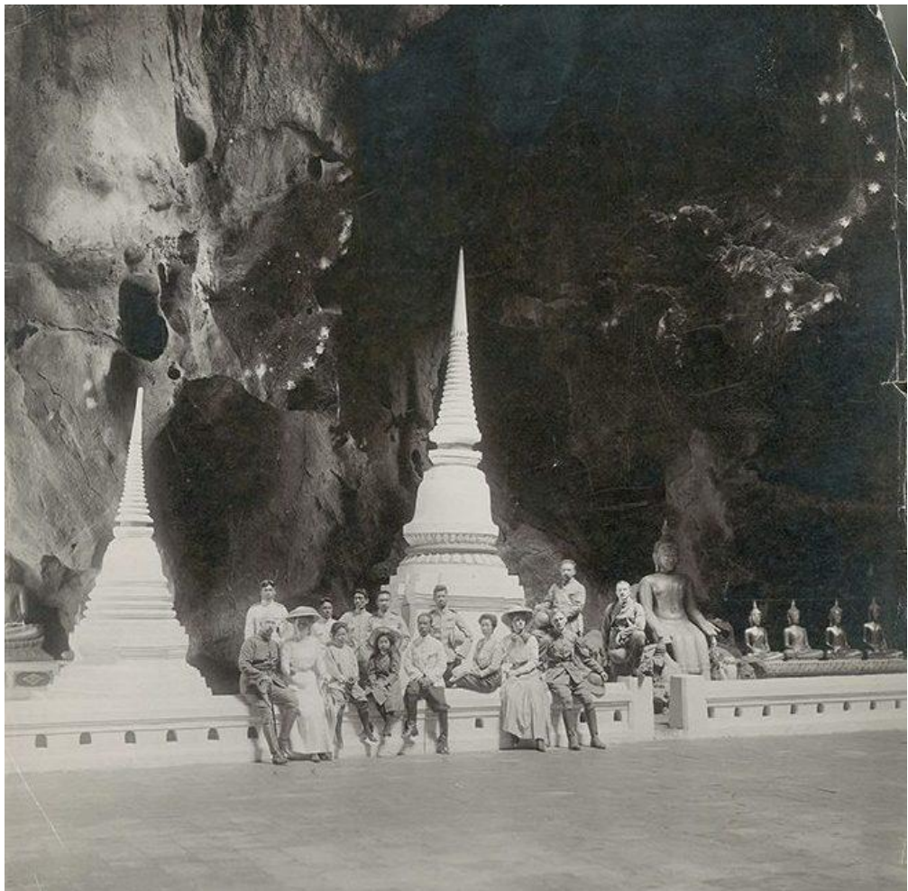
ภาพประกอบ 3 ภาพถ่ายภายใน “ถ้ำเขาหลวง” เพชรบุรี ในสมัยรัชกาลที่ ๕