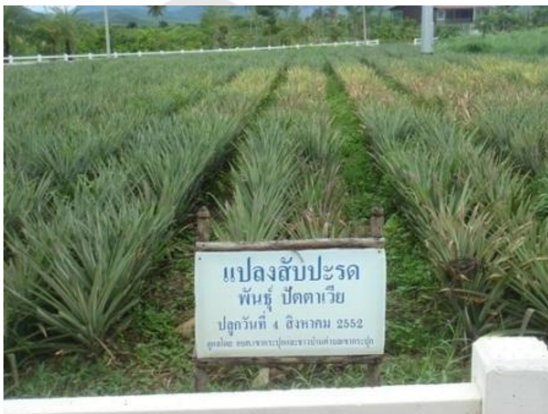
ภาพประกอบ 6 แปลงสับปะรด พันธุ์ปัตตาเวีย

โครงการซั้งหัวมัน ตามพระราชดำริ เปิดให้บุคคลทั่วไปเข้าเยี่ยมชมได้ทุกวัน ตั้งแต่เวลา 09.00-16.30 น. (เว็บไซต์ trueid )