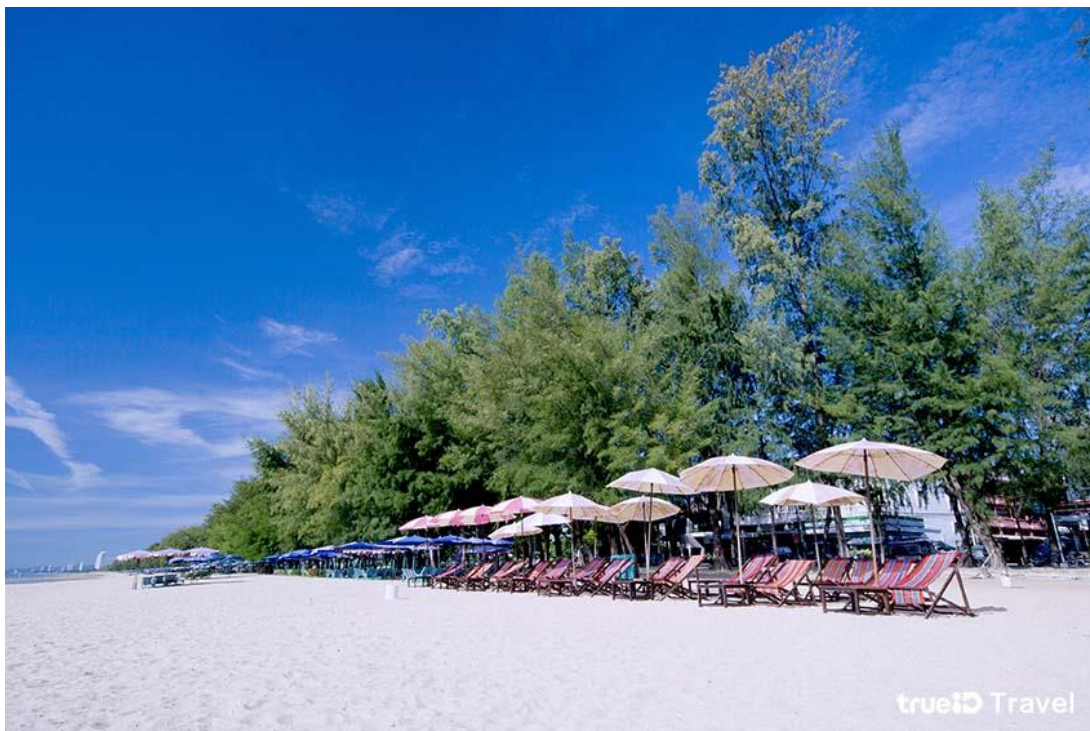
ภาพประกอบ 7 หาดชะอำ

หาดชะอำ อยู่ห่างจากตัวเมืองเพชรบุรี 41 กิโลเมตร มีทางแยกซ้ายเข้าชายหาด ระยะทางประมาณ 2 กม. เป็นชายหาดที่สวยงามและมีชื่อเสียงของจังหวัดเพชรบุรี เดิมชะอำเป็นเพียงตำบลหนึ่งขึ้นอยู่กับอำเภอหนองจอก แต่ภายหลังที่หัวหินมีชื่อเสียง ที่ดินแถบชายทะเลถูกจับจองหมด และได้พบว่าหาดชะอำเป็นชายหาดที่สวยงามไม่แพ้หัวหิน ชะอำจึงเริ่มเป็นที่รู้จักตั้งแต่นั้นมา ชะอำได้รับการพัฒนาเจริญเติบโตขึ้น และยกฐานะเป็นอำเภอจวบจนปัจจุบัน (สำนักบริหารยุทธศาสตร์)