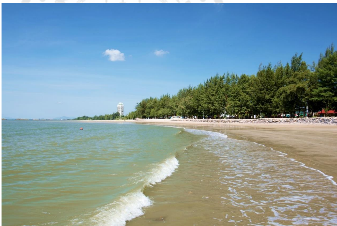
ภาพประกอบ 12 หาดเจ้าสำราญ

ชายหาดแห่งนี้เจริญถึงขีดสุดในสมัยพระบาทสมเด็จพระมงกุฎเกล้าเจ้าอยู่หัวรัชกาลที่ 6 ที่ได้โปรดเกล้าฯ ให้สร้างค่ายหลวงขึ้นมาแล้วเรียกว่า "ค่ายหลวงบางทะเล" ตามชื่อตำบลบางทะเล อันเป็นที่ตั้งพร้อมๆกับการสร้างพระตำหนักริมหาดที่ชื่อว่า "พระตำหนักหาดเจ้าสำราญ" ต่อมาภายหลังได้ทรงเปลี่ยนชื่อตำบลเสียใหม่เป็นตำบลหาดเจ้าสำราญ เนื่องจากทรงเห็นว่าชื่อเดิมนั้นไม่เป็นมงคลพร้อมกับย้ายพระตำหนักหาดเจ้าสำราญไปยังจุดที่เป็นที่ตั้งของพระราชินีเวสท์มฤคทายวันในปัจจุบัน (การท่องเที่ยวแห่งประเทศไทย)