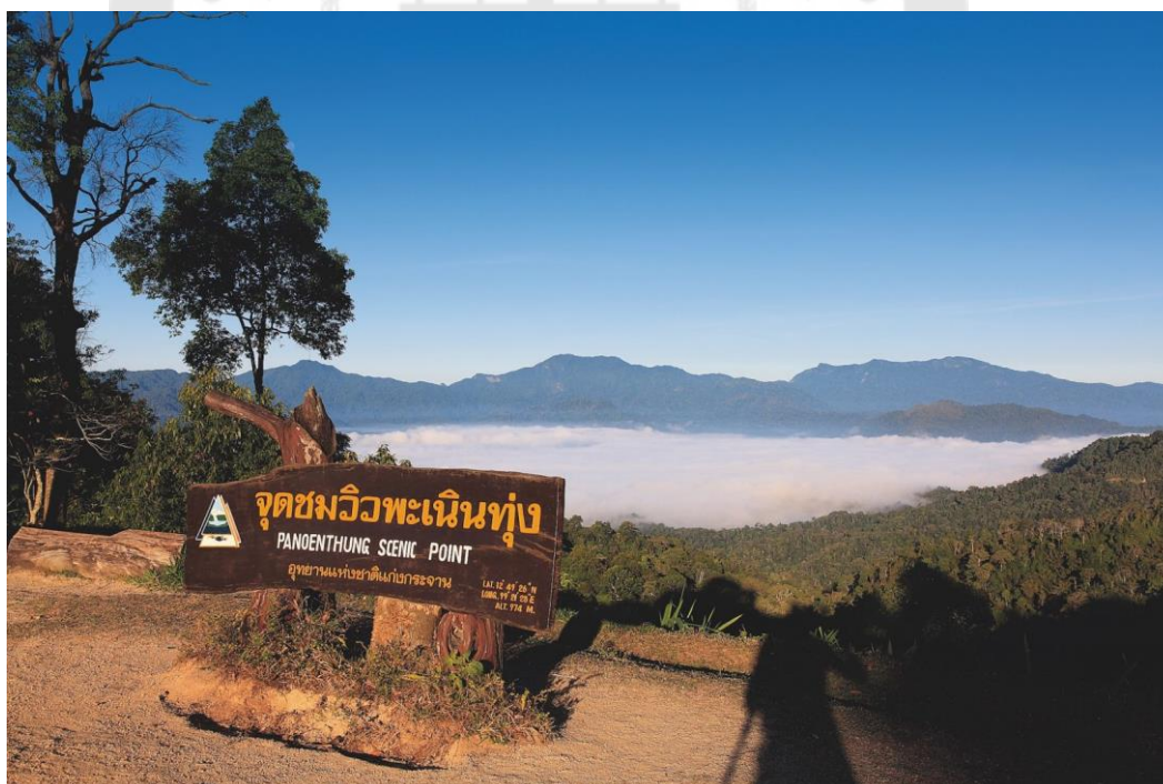
ภาพประกอบ 9 จุดชมวิวพะเนินทุ่ง

อุทยานแห่งชาติแก่งกระจาน เปิดให้เข้าชมทุกวัน ตั้งแต่เวลา 06.00-18.00 น.