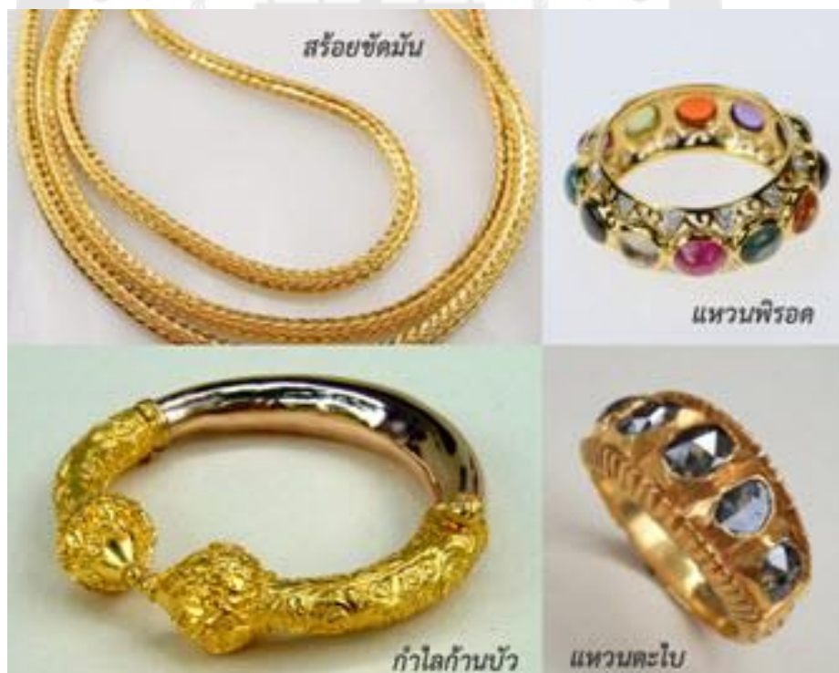
ภาพประกอบ 19 เครื่องทองโบราณเพชรบุรี

เครื่องทองโบราณเพชรบุรีเกิดขึ้นในช่วงต้นกรุงรัตนโกสินทร์ เมื่อครั้งที่พระบาทสมเด็จพระจอมเกล้าเจ้าอยู่หัว โปรดเกล้าฯ ให้ก่อสร้างพระราชวังพระนครคีรี จึงทำให้มีการส่งช่างหลวงในสำนักช่างสิบหมู่ ซึ่งรวมถึงช่างทองหลวงเข้าไปยังเมืองเพชรบุรี ดังนั้น การที่ช่างสิบหมู่ในราชสำนักได้มารวมตัวกันอยู่ที่เมืองเพชรบุรี จึงทำให้ศิลปะชั้นสูงได้หลั่งไหลเข้าสู่เมืองเพชรบุรี จนเกิดการถ่ายทอดความรู้ให้กับคนในท้องถิ่น โดยศิลปะการทำเครื่องทองได้ถูกถ่ายทอดให้แก่ช่างทองพื้นเมืองเพชรบุรีที่ได้มีโอกาสมาเป็นผู้ช่วยช่างหลวง กลายเป็นเครื่องทองเมืองเพชรที่มีเอกลักษณ์พิเศษเฉพาะตัว คือ มีความเป็นงานศิลปะแบบไทยโบราณผสมผสานกับความเป็นพื้นบ้านของเพชรบุรีที่นำเสนอความงดงามของธรรมชาติ และการใช้ประโยชน์จากเครื่องทองเอาไว้อย่างกลมกลืน (สถาบันพัฒนาอุตสาหกรรมสิ่งทอ)