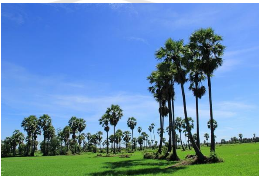
ภาพประกอบ 14 ต้นตาลโตนด

น้ำตาลโตนดวังตาลมีขนาดบรรจุ 500 กรัม ราคากระปุกละ 45 บาท (Facebook วังตาล น้ำตาลโตนดแท้ 100%)