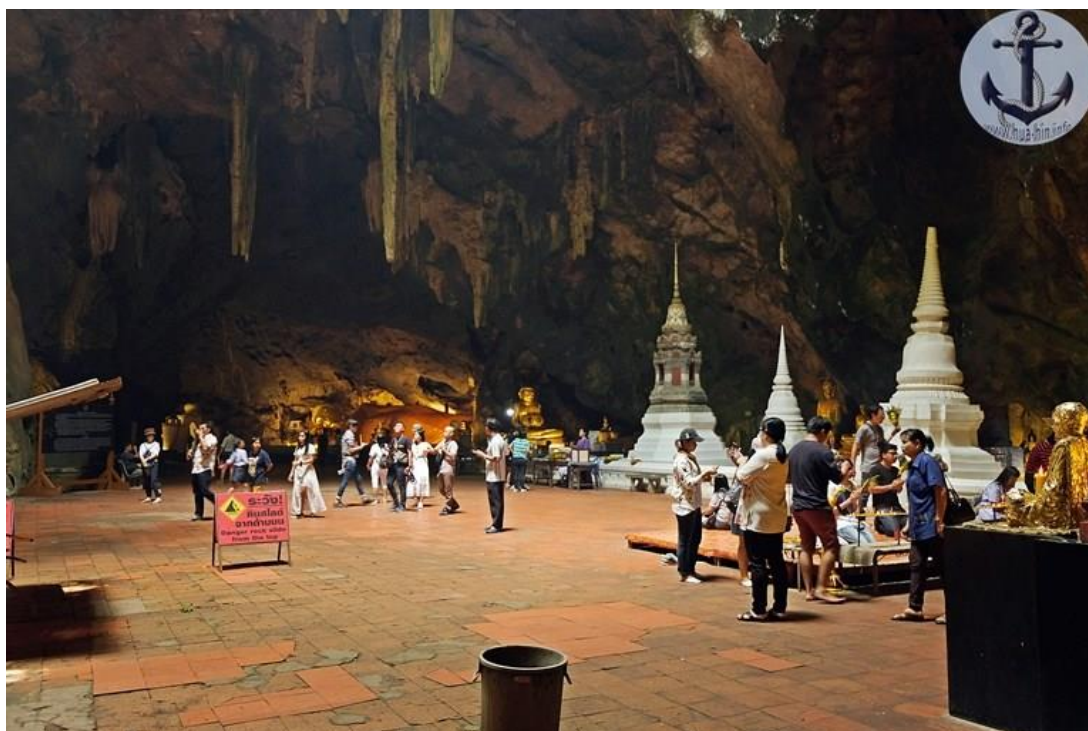
ภาพประกอบ 4 ภาพภายในถ้ำเขาหลวง โดยมีพระพุทธรูปบาทจำลอง และหินงอกหินย้อย

ถ้ำเขาหลวง เปิดให้เที่ยวชมทุกวัน วันจันทร์-ศุกร์ เปิด 09.00 - 16.00 น. วันเสาร์-อาทิตย์ เปิด 09.00-17.00 น. (ผู้จัดการออนไลน์)