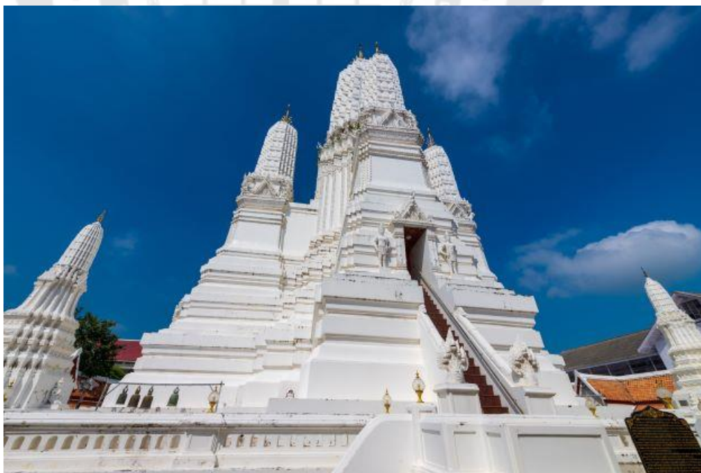
ภาพประกอบ 10 วัดมหาธาตุวรวิหาร

วัดมหาธาตุวรวิหาร เปิดให้เข้าชมทุกวัน ตั้งแต่เวลา 06.00-17.00 น.