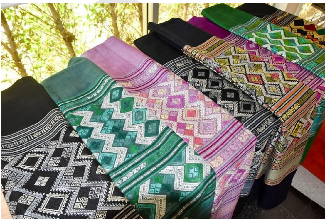
ภาพประกอบ 18 ผ้าลายสุวรรณวัชร

ปัจจุบันมีการพัฒนาต่อยอดการทอลายไปสู่ชุมชนพัฒนาลายผ้าให้ชาวจังหวัดเพชรบุรีสามารถใช้ได้ในชีวิตประจำวัน มีการออกแบบ ผลิต การทอให้เหมาะสมกับการที่จะนำมาใช้งาน