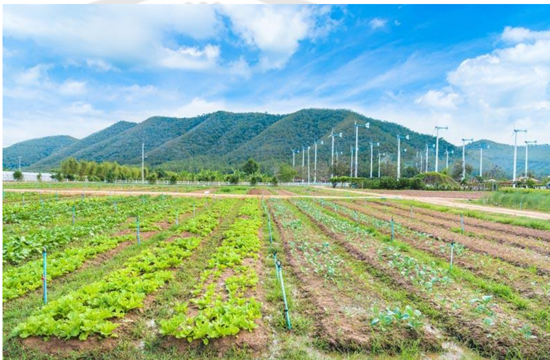
ภาพประกอบ 5 โครงการซั้งห้วมัน ตามพระราชดำริ

พื้นที่ที่ตั้งของโครงการอยู่ที่ บ้านหนองคอกไก่ ตำบลเขากระปุก อำเภอท่ายาง จังหวัดเพชรบุรี โดยในปี พ.ศ.2551 พระบาทสมเด็จพระเจ้าอยู่หัวทรงมีพระราชดำริให้ทำเป็นโครงการตัวอย่างด้านการเกษตร รวบรวมพันธุ์พืชเศรษฐกิจในพื้นที่ อ.ท่ายาง จ.เพชรบุรี และพื้นที่ใกล้เคียง มาปลูกไว้ที่นี่ โดยเริ่มดำเนินการตั้งแต่วันที่ 13 กรกฎาคม พ.ศ.2552 เป็นต้นมา และพระราชทานพันธุ์มันเทศซึ่งออกมาจากห้วมันที่ตั้งโชว์ไว้บนตารั้งในห้อง ทรงงานที่วังไกลกังวลให้นำมาปลูกไว้ที่นี่ พระราชทานชื่อโครงการว่า “โครงการซั้งห้วมัน ตามพระราชดำริ” มีเป้าหมายต้องการให้เป็นศูนย์รวมพืชเศรษฐกิจของ อ.ท่ายาง จ.เพชรบุรี โดยเลือกพันธุ์พืชท้องถิ่นที่ดีที่สุดเข้ามาปลูก แล้วให้ภาครัฐและชาวบ้านร่วมดูแลด้วยกัน เพื่อแลกเปลี่ยนแนวคิด ( เว็บไซต์ porpeang.org )