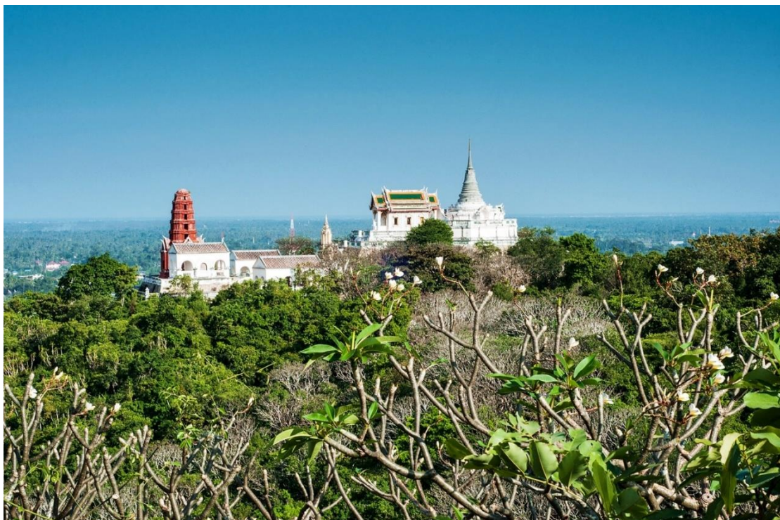
ภาพประกอบ 2 อุทยานประวัติศาสตร์พระนครคีรี (เขาวัง)

นักท่องเที่ยวสามารถขึ้นชมอุทยานประวัติศาสตร์พระนครคีรี (เขาวัง) ได้โดยการเดินขึ้นหรือโดยสารรถรางไฟฟ้าก็ได้ (ตัวไป-กลับ) ค่าเข้าชม ชาวไทย ผู้ใหญ่ 80 บาท เด็ก 15 บาท ชาวต่างชาติ ผู้ใหญ่ 230 บาท เด็ก 15 บาท ราคานี้รวมค่าบริการรถรางขึ้นและลงเขาวังด้วยแล้ว สำหรับพิพิธภัณฑ์สถานแห่งชาติ พระนครคีรี เปิดให้เข้าชมทุกวันเวลา 08:30-16:30 น. (การท่องเที่ยวแห่งประเทศไทย)