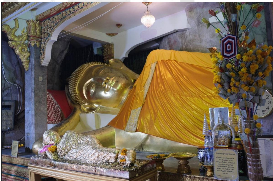
ภาพประกอบ 11 พระพุทธไสยาสน์

วัดถ้ำเขาย้อย เปิดให้เข้าชมทุกวัน ตั้งแต่เวลา 08.30-17.00 น.