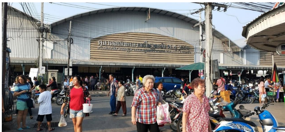
ภาพประกอบ 13 ตลาดเทศบาลชะอำ

ตลาดสดเทศบาลชะอำ เปิดทุกวัน ช่วงเช้าเวลา 06.00-11.00 น. ช่วงเย็นเวลา 16.00-20.00 น.