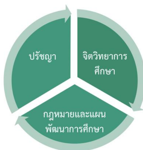
ภาพประกอบ 2 ฐานคิดสำคัญ 3 ด้าน

ผลการทบทวนฐานคิดสำคัญของสังคมในเรื่องความทั่วถึงและเท่าเทียมทางการศึกษาสามารถสรุปเป็นแผนภาพ ดังนี้