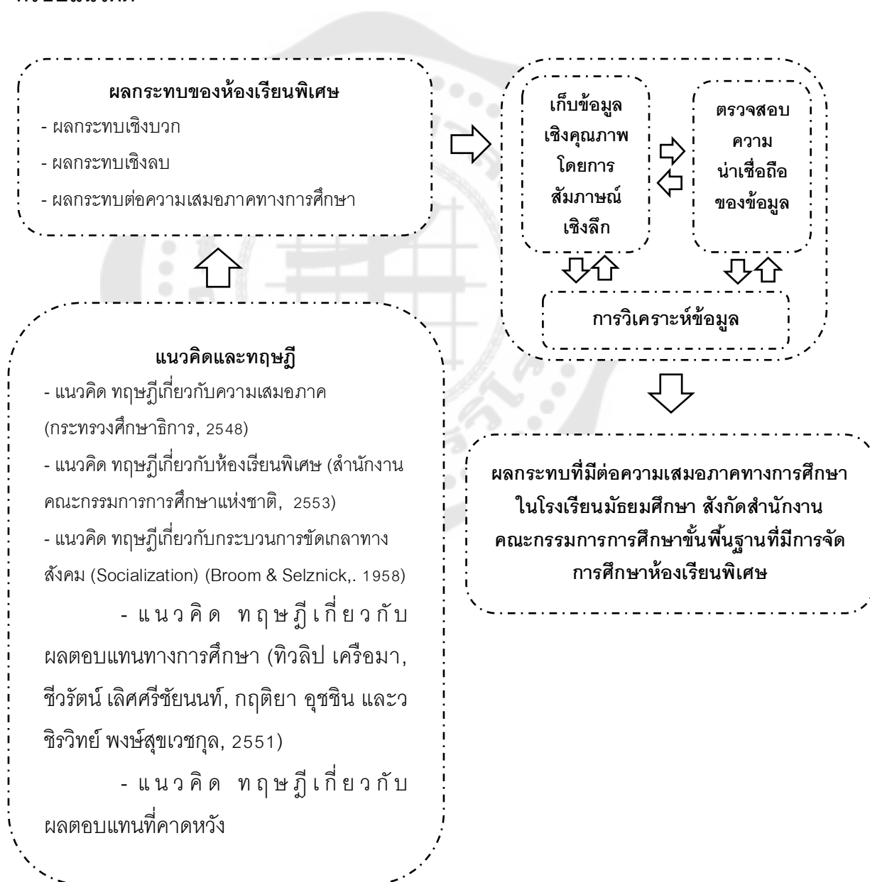
ภาพประกอบ 1 กรอบแนวคิดการวิจัย