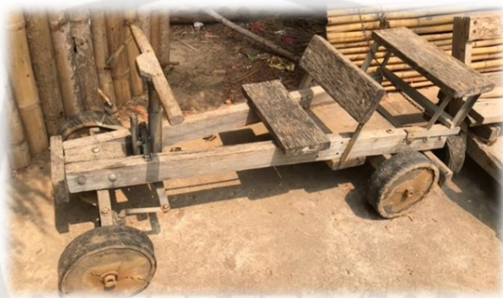
ภาพประกอบ 34 รถเคลื่อนล้อไม้

รถเคลื่อนล้อไม้ (ฟอร์มูลามั่ง) เป็นรถที่ประดิษฐ์จากภูมิปัญญาของชาวมั่ง โดยประดิษฐ์ขึ้นมาเพื่อเป็นการละเล่น เนื่องจากชาวมั่งเข็มน้อยอาศัยอยู่บนภูเขาสูง ทำให้พื้นที่ดังกล่าวมีความสูงชันสามารถส่งผลให้รถเคลื่อนตัวลงจากเขาได้ง่าย โดยแต่ก่อนรถเคลื่อนล้อไม้ประดิษฐ์ให้สามารถนั่งได้แค่คนเดียว ไม่มีสามารถบังคับทิศทางของรถ และไม่มีเบรคหยุด แต่ในปัจจุบันชาวมั่งประดิษฐ์ให้รถเคลื่อนล้อไม้ที่สามารถโดยสารได้สูงสุด 2 คน ควบคุมทิศทางได้ และมีเบรคหยุด ทำให้เกิดความปลอดภัยแก่ผู้เล่นมากขึ้น โดยชาวมั่งจะเล่นรถเคลื่อนล้อไม้ภายในหมู่บ้านเข็มน้อยเท่านั้น โดยการลากรถขึ้นไปยังเนินสูงที่อยู่ในหมู่บ้าน แล้วปล่อยให้รถเคลื่อนตัวลงเองตามเนินชัน สร้างความสนุกสนานให้แก่ผู้ที่ได้เล่น