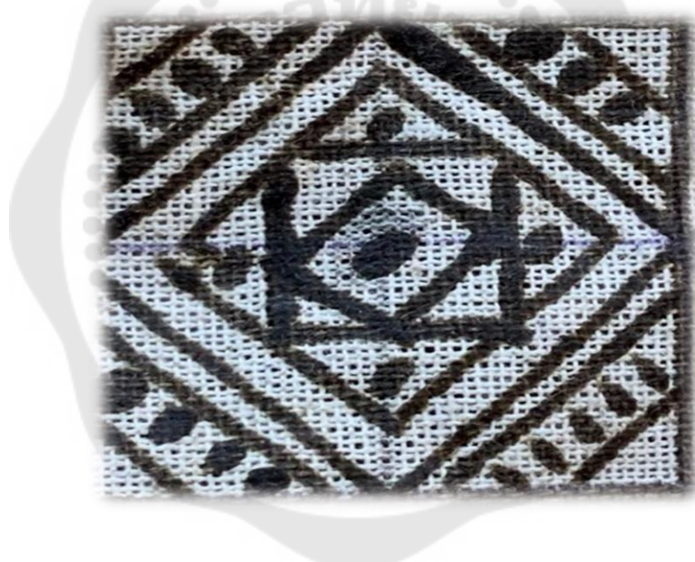
ภาพประกอบ 30 ลายดอกพักทอง

ลายดอกพักทอง มีความเชื่อว่า ลายพักทองเป็นสัญลักษณ์แห่งความกินดีอยู่ดี ความมั่งมี ศรีสุข ผู้ที่สวมใส่จะมีเงิน มีทองและมีชีวิตที่ดีขึ้น