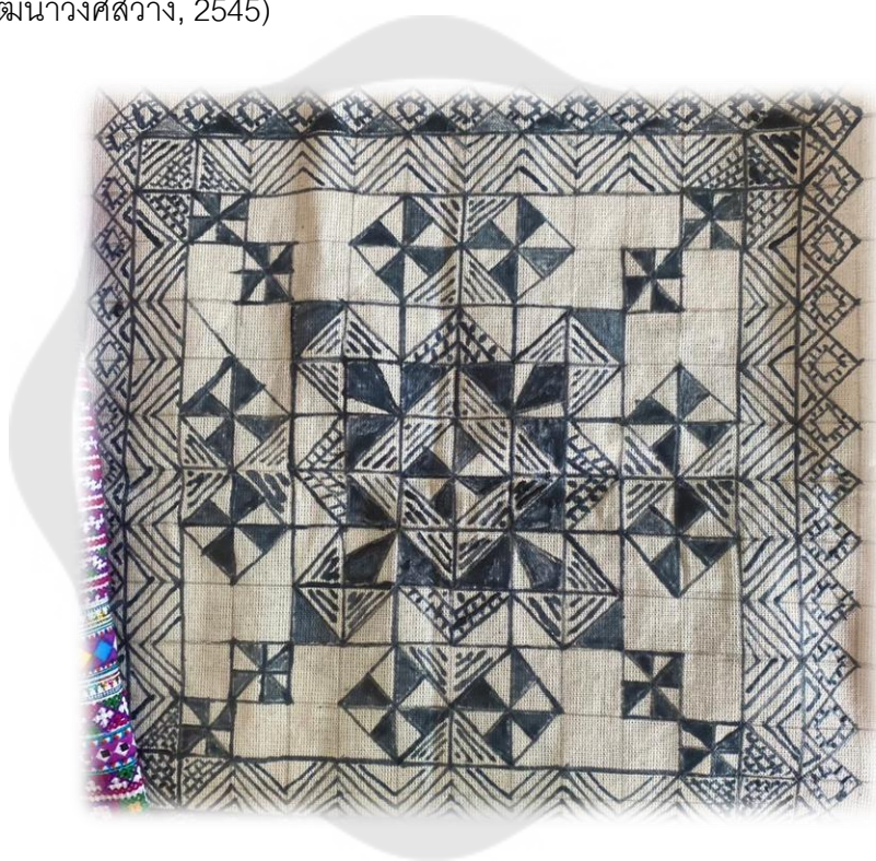
ภาพประกอบ 14 การเขียนเทียนลงบนผ้า

ต่าง ๆ ด้วยด้ายหลากหลายสีส้น แล้วจึงนำมาสวมใส่เป็นชุดประจำชนเผ่าที่งดงามลวดลายบนผืนผ้า ทั้งนี้ในปัจจุบัน ชาวม้งหันมาใช้ผ้าดิบจากโรงงานแทนผ้าใยกล้วย เพราะขั้นตอนการผลิตยุ่งยากและหายากขึ้นเรื่อย ๆ แต่สำหรับขั้นตอนการเขียนผ้าลายเทียน การย้อมสี จนกระทั่งมาเป็นผ้าสำเร็จ ก็ยังคงเดิมไม่เปลี่ยนแปลง แต่ชาวม้งที่มีภูมิปัญญาในการเขียนเทียนลดน้อยลงแล้ว และไม่ได้รับการสืบทอดภูมิปัญญาการเขียนเทียนสู่คนรุ่นใหม่เท่าไรนัก กลุ่มวิสาหกิจการท่องเที่ยวเชิงวัฒนธรรมม้งบ้านเข็กน้อย และปราชญ์ชุมชนจึงมีความต้องการสานต่อภูมิปัญญาการเขียนเทียนต่อไป (สุมิตรา เสรีเนติกุล, การสื่อสารส่วนบุคคล, 28 มีนาคม 2565; อนุรัตน์ วัฒนาวงศ์สว่าง, 2545)