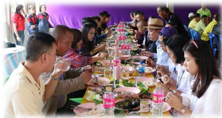
ภาพประกอบ 12 ประเพณีกินข้าวปีใหม่

เจ็บป่วยมาตลอด 1 ปี แล้วจึงเชิญแขกผู้ใหญ่ และญาติพี่น้องที่มานั่งประจำโต๊ะอาหาร เมื่อแขกผู้ใหญ่นั่งประจำโต๊ะอาหาร ตัวแทนแขกจะลุกขึ้นเพื่อกล่าวคำขอบคุณและอวยพรให้แก่เจ้าภาพก่อนที่จะรับประทานอาหารใหม่และอาหาร โดยบุคคลที่จะเป็นคนทำพิธีจะเรียกบรรพบุรุษตามลำดับของคนที่ยังมีชีวิตอยู่ที่เป็นลูกหลานของผู้ล่วงลับไปแล้ว