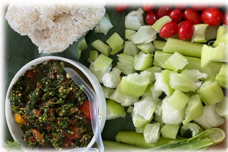
ภาพประกอบ 25 น้ำพริกผักซีม้ง