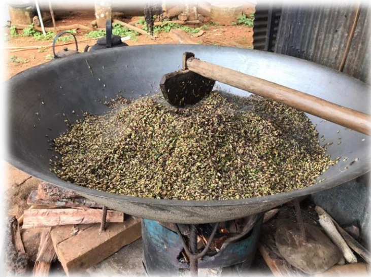
ภาพประกอบ 18 การคั่วข้าวใหม่

ส่วนช่วยในการออกผลผลิตของข้าวที่ปลูกหลานได้ทำการปลูกมาตลอด 1 ปีที่ผ่านมา ซึ่งภายในงานจะประกอบด้วย การรำแคน การแข่งขันตำข้าวใหม่ การจำหน่ายผลิตภัณฑ์สินค้าหนึ่งตำบลหนึ่งผลิตภัณฑ์ OTOP ประจำหมู่บ้าน และร่วมรับประทานอาหารเย็นพร้อมกัน