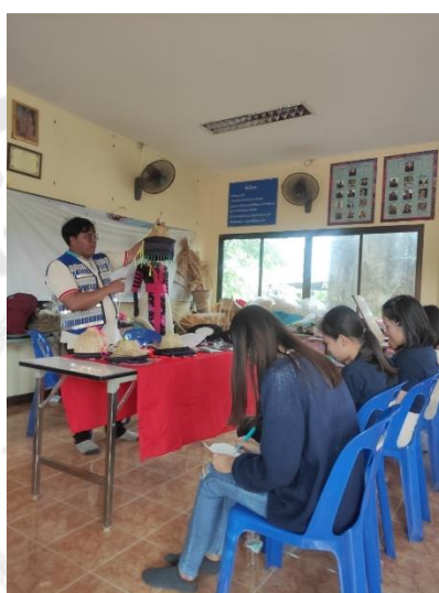
การอภิปรายแสดงความคิดเห็นร่วมกันระหว่างนักท่องเที่ยวกับชุมชน