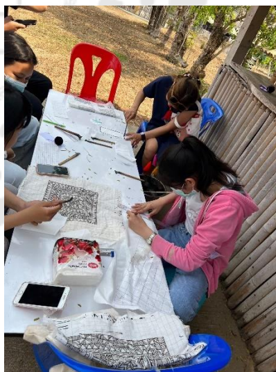
การทดลองจัดดำเนินกิจกรรมผ้าเขียนเทียน