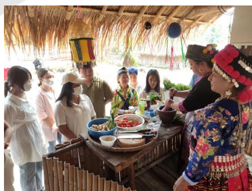
การทดลองจัดดำเนินกิจกรรมทำอาหารพื้นถิ่น