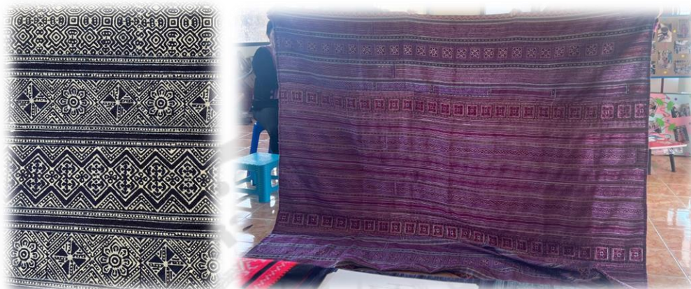
ภาพประกอบ 38 ผ้าเขียนเทียน

ผ้าเขียนเทียน ผ้าเขียนเทียนของชาวม้งเข็กน้อยมีความโดดเด่นในเรื่องการนำลวดลายต่าง ๆ ที่ถูกสั่งสอนและถ่ายทอดส่งต่อกันมาอย่างยาวนาน นำมาเขียนให้เกิดเป็นลวดลายที่สวยงาม โดยผ้าเขียนเทียนจะไม่มีลายที่เฉพาะเจาะจงขึ้นอยู่กับผู้เขียนอยากนำเสนอให้ลายออกมาในรูปแบบใด เป็นการใช้ความคิดสร้างสรรค์ของผู้เขียนเทียน จึงส่งผลให้ผ้าเขียนเทียนเป็นผ้าที่เป็นเอกลักษณ์และมีเพียงชิ้นเดียวบนโลกเท่านั้น