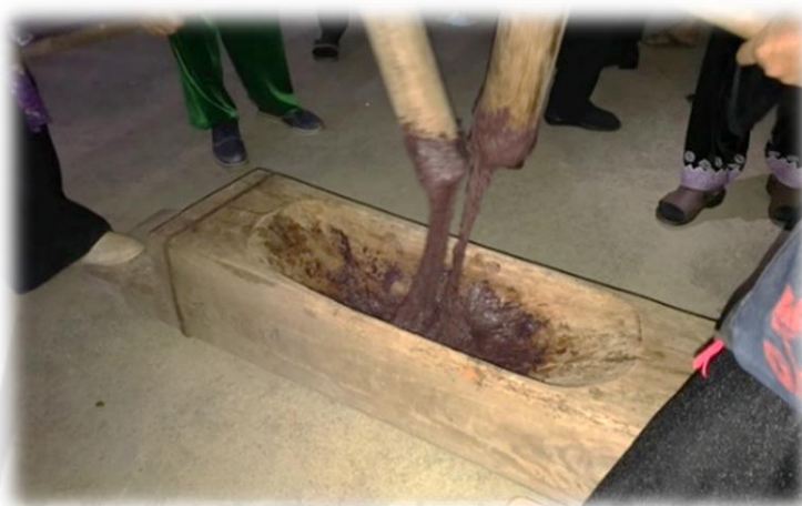
ภาพประกอบ 27 การตำพิชซ่าม้ง

โดยส่วนใหญ่จะใส่รางไม้ขนาดใหญ่ และใช้ไม้ตำโดยต้องใช้แรงคนอย่างน้อยสองคนช่วยกันตำข้าวเหนียวในครกรางไม้ให้ละเอียด แล้วนำวางบนใบตองสด ห่อและรัดให้แบน เพื่อพร้อมที่จะนำไปปิ้งรับประทาน ขนมชนิดนี้จะเป็นขนมที่มีส่วนผสมจากข้าวอย่างเดียว ดังนั้นเพื่อให้เกิดรสชาติในการรับประทาน ชาวม้งจึงนำไปจุ่มกับนมข้น น้ำผึ้ง หรือน้ำอ้อย โดยชาวม้งบ้านเข็กน้อยมักเรียกขนมชนิดนี้ว่า “พิชซ่าม้ง”