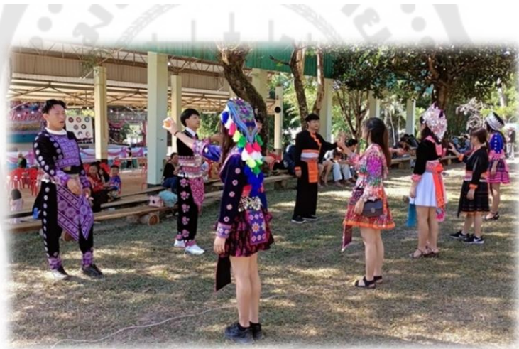
ภาพประกอบ 21 การโยนลูกช่วง