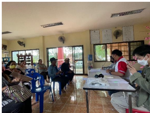
การจัดสนทนากลุ่มเพื่อเก็บข้อมูลการวิจัยระยะที่ 1 ในวันที่ 17 ธันวาคม พ.ศ. 2565