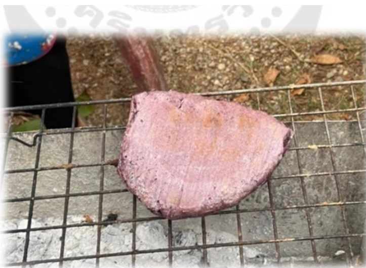
ภาพประกอบ 28 ข้าวปุกหรือห้วย