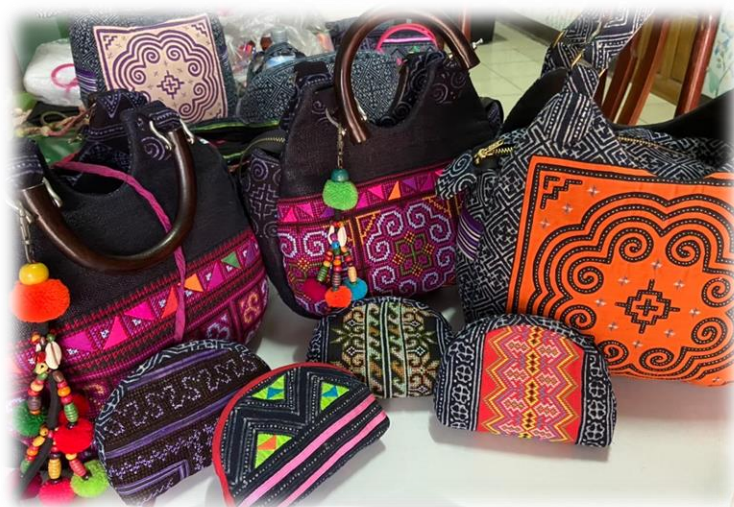
ภาพประกอบ 3 ของที่ระลึกประเภทงานศิลปะของชุมชนบ้านเข็กน้อย