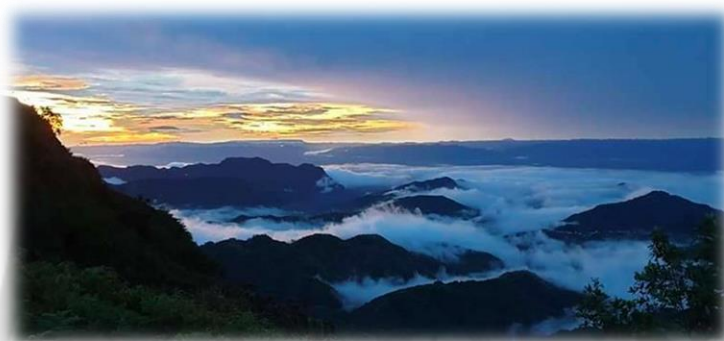
ภาพประกอบ 7 ผาซ่อนแก้ว

ผาซ่อนแก้ว (ผาตัดหรือดอยเขาขาด) เป็นเทือกเขาสูงกว่าระดับน้ำทะเล ประมาณ 1,400 เมตร ด้านทิศตะวันออกเป็นหน้าผาสูงชัน มีเขตแดนติดต่อกับตำบลเข็กน้อย และตำบลแคมป์สน อำเภอเขาค้อ จังหวัดเพชรบูรณ์ พื้นที่บนยอดเขาขาดบางส่วนเป็นพื้นที่ราบสูง บางส่วนลาดชัน อากาศเย็นสบายตลอดปี มีธรรมชาติที่สวยงาม มีพันธุ์ไม้ป่าหลายชนิดที่หายาก อีกทั้งยังเป็นที่อยู่อาศัยของสัตว์ป่าสงวนหลายชนิด เช่น เลียงผา ลิง นกชนิดต่าง ๆ เป็นต้น