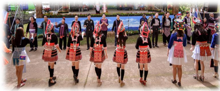
ภาพประกอบ 10 การโยนลูกช่วง