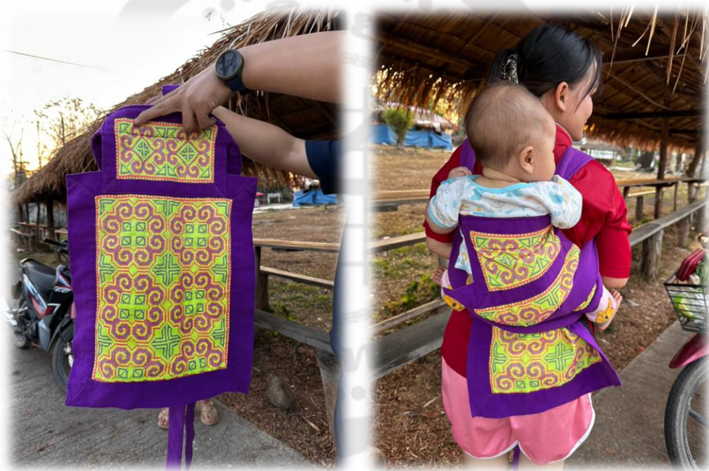
ภาพประกอบ 37 ผ้าอุ้มเด็ก

ผ้าอุ้มเด็ก (ได้เจีย) ผ้าอุ้มเด็กเป็นอีกหนึ่งผลิตภัณฑ์ที่มาจากภูมิปัญญาของชาวม้ง เป็นผ้าที่ฝ่ายหญิงจะเป็นผู้เย็บและปักลวดลายด้วยตนเอง ใช้สำหรับอุ้มเด็กแรกเกิดถึงอายุประมาณ 2 ขวบ เนื่องจากชาวม้งมีอาชีพหลักเป็นเกษตรกรรม เวลาที่ต้องทำงานต้องขึ้นไปยังบนเขาสูง และผู้หญิงที่เลี้ยงลูกเองต้องนำลูกขึ้นไปดูแลระหว่างทำงานด้วย จึงได้ประดิษฐ์ผ้าอุ้มเด็กเพื่อเป็นการช่วยพยุงลูกน้อยไม่ให้ตก และเพื่อจะได้ใช้มือในการทำงานได้อย่างสะดวก โดยเด็กจะถูกห่ออยู่ในผ้า แล้วจะนำเด็กแบกไว้ข้างหลังโดยการผูกผ้ากับตัวเอง และนอกจากจะใช้ผ้าอุ้มเด็กในระหว่างการทำงาน ยังสามารถใช้ในชีวิตประจำวันได้ โดยไม่ต้องใช้มืออุ้มเด็กตลอดเวลา สามารถผูกผ้าเพื่ออุ้มเด็กได้ทั้งข้างหน้าและข้างหลัง ขึ้นอยู่กับความสะดวกของผู้ที่อุ้มเด็ก