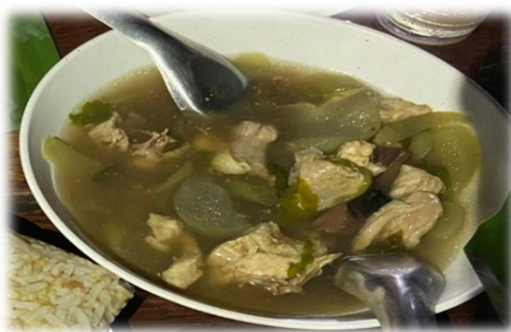
ภาพประกอบ 24 ไก่ต้มสมุนไพร