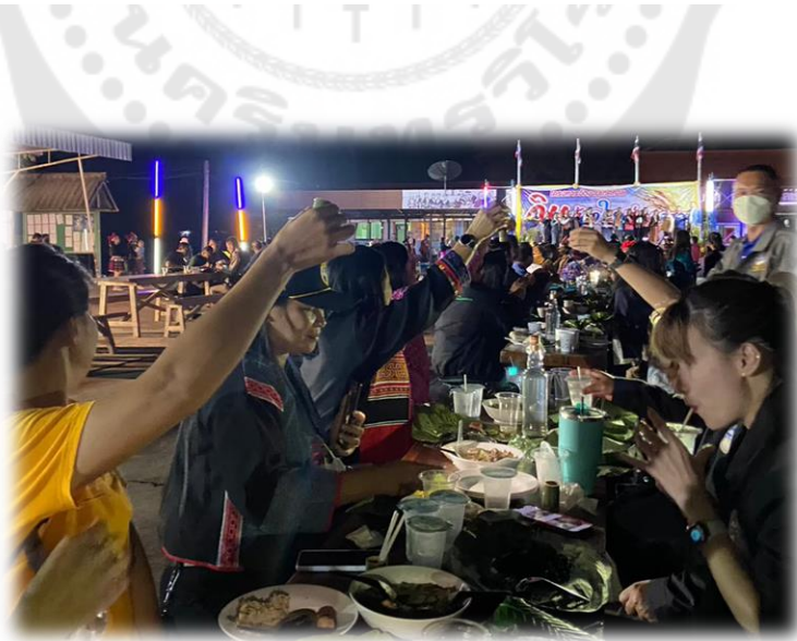
ภาพประกอบ 19 การร่วมรับประทานอาหารในประเพณีกินข้าวใหม่