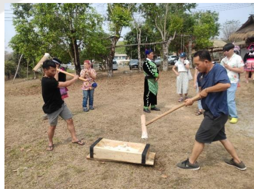
การทดลองจัดดำเนินกิจกรรมทำพิซซำม้ง