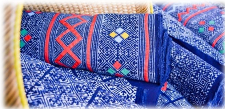
ภาพประกอบ 15 ผ้าเขียนเทียนมั่งที่ผ่านการย้อมสี