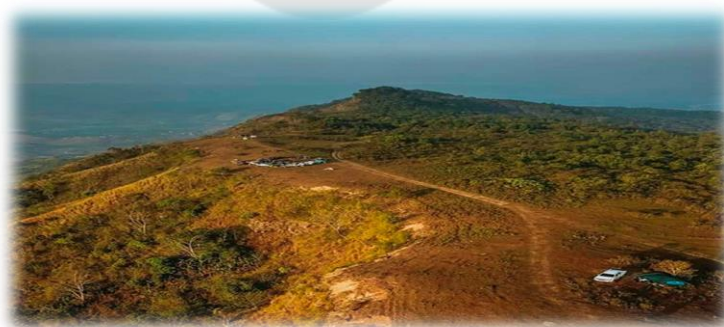
ภาพประกอบ 6 ดอยตัวเพ่ง

เป็นดอยที่อยู่ระหว่างทางไปภูทับเบิก อยู่ในพื้นที่หมู่ที่ 1 บ้านห้วยน้ำขาว เป็นเส้นทางลัดที่สวยงาม ประกอบไปด้วยพืชนานาชนิดและต้นไม้ใหญ่ เช่น ต้นเมเปิ้ล ซึ่งจะมีใบสุกสีแดงในช่วงเดือน พฤศจิกายน ถึง เดือนธันวาคม ระยะทางจากบ้านเข็กน้อย ประมาณ 20 กิโลเมตร