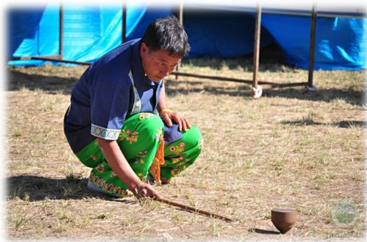
ภาพประกอบ 32 การเล่นเกมตีลูกข่างม้ง