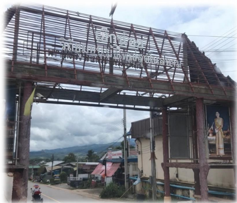
ภาพประกอบ 17 บริเวณทางเข้าสู่ชุมชนบ้านเข็กน้อย

หมู่บ้านเข็กน้อยได้รับการยกระดับเป็นสภาตำบลเมื่อปี พ.ศ. 2537 ได้รับการยกระดับเป็นองค์การบริหารส่วนตำบลเข็กน้อยเมื่อปี พ.ศ. 2540 ปัจจุบันได้รับการปรับเป็นองค์การบริหารส่วนตำบลขนาดกลาง หมู่บ้านเข็กน้อยประกอบด้วย 12 หมู่บ้าน ได้แก่ หมู่ที่ 1 บ้านน้ำขาว หมู่ที่ 2 บ้านเข็กน้อย หมู่ที่ 3 บ้านปากกล้วย หมู่ที่ 4 บ้านเข็กน้อย หมู่ที่ 5 บ้านเล่าลือเก่า หมู่ที่ 6 บ้านปากทาง หมู่ที่ 7 บ้านศักดิ์เจริญ หมู่ที่ 8 หมู่บ้านชัยชน หมู่ที่ 9 บ้านประกอบสุข หมู่ที่ 10 บ้านเจริญพัฒนา หมู่ที่ 11 บ้านคีรีรัตน์ และหมู่ที่ 12 บ้านสันติสุข