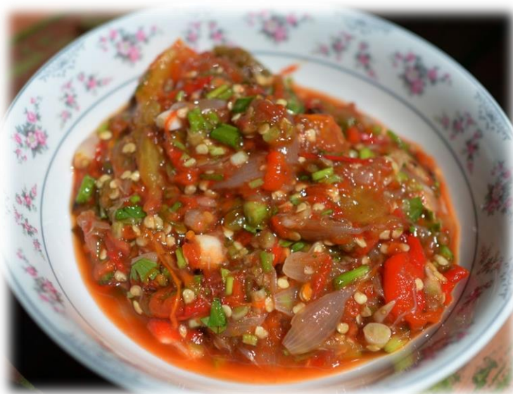
ภาพประกอบ 26 น้ำพริกมะเขือเทศม้ง