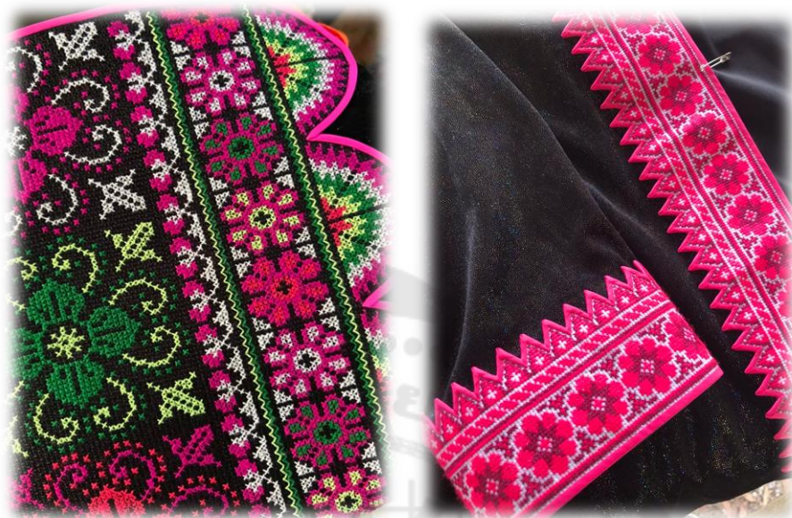
ภาพประกอบ 13 ผ้าปักม้ง

และผู้หญิง แต่ตอนนี้ส่วนใหญ่จะไม่ค่อยปักกันเองแล้ว จะซื้อสำเร็จรูปมาใส่ ซึ่งส่วนใหญ่จะเป็นงานเครื่องจักรไม่ใช่งานปักมือ (องค์การบริหารส่วนตำบลเข็กน้อย, 2561)