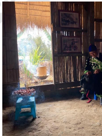
การทดลองจัดดำเนินกิจกรรมสู่ขวัญนักท่องเที่ยว