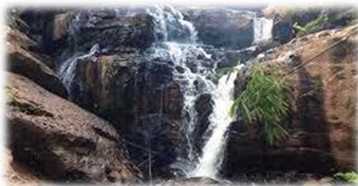
ภาพประกอบ 8 น้ำตกแก่งสาวน้อย