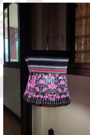
การพัฒนาผลิตภัณฑ์ไหมไฟม้ง