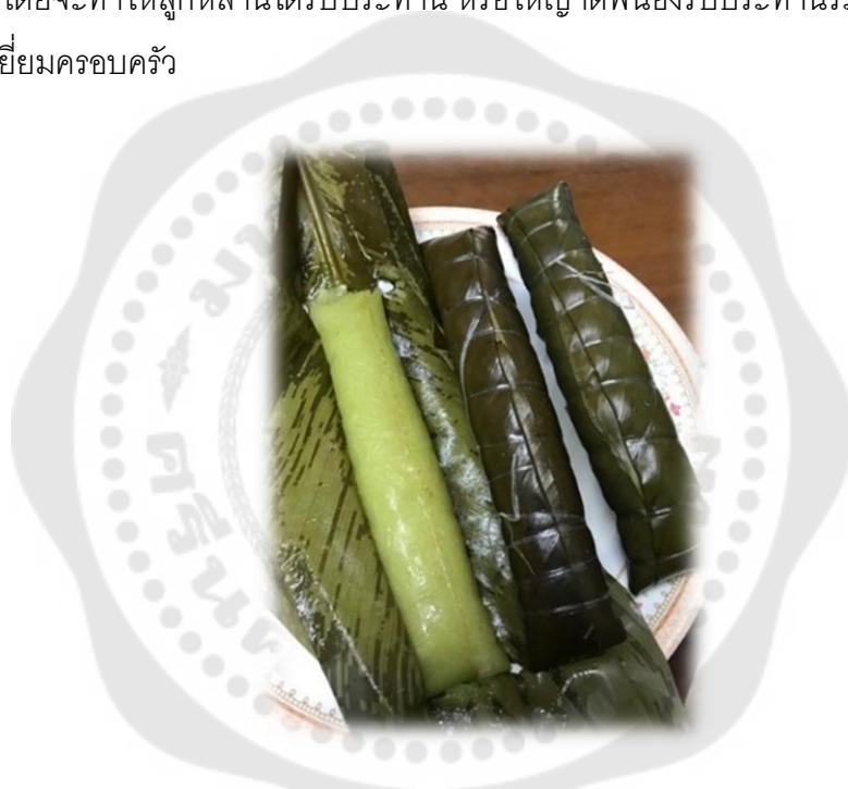
ภาพประกอบ 29 ห้วยเจาบัว

ห้วยเจาบัว เป็นอาหารที่ทำขึ้นสำหรับพกไว้เมื่อมีการเข้าไปเดินหาของในป่า หรือ การไปทำการเกษตรที่ต้องออกเดินทางห่างจากบ้านที่ชาวมังอาศัยอยู่เนื่องจากพกพาง่ายและเน่าเสียยาก โดยห้วยเจาบัวเป็นการนำข้าวเหนียวที่แช่น้ำไว้ผสมกับเนื้อหมู บางครอบครัวอาจเป็นข้าวเหนียวอย่างเดียว แล้วนำไปห่อให้แน่นด้วยใบหญ้าไม้กวาดที่ไม่แก่และไม่อ่อนจนเกินไป ห่อให้มีขนาดเท่ากับด้ามมีดหวด เพื่อความสะดวกสำหรับพกพา ห้วยเจาบัวมีความยาวประมาณ 15 – 20 เซนติเมตร จากนั้นใช้ตอกมัดให้แน่น แล้วจึงนำไปต้มจนสุก ปัจจุบันมีการทำห้วยเจาบัวเกือบทุกครัวเรือน โดยจะทำให้ลูกหลานได้รับประทาน หรือให้ญาติพี่น้องรับประทานระหว่างเดินทางกลับหลังจากเยี่ยมครอบครัว