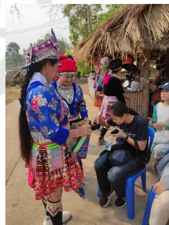
การจัดโปรแกรมท่องเที่ยววันรุ่งเพื่อทดลองและประเมินกิจกรรมการท่องเที่ยวเชิงวัฒนธรรมบ้าน เข็กน้อย (การต้อนรับนักท่องเที่ยว)