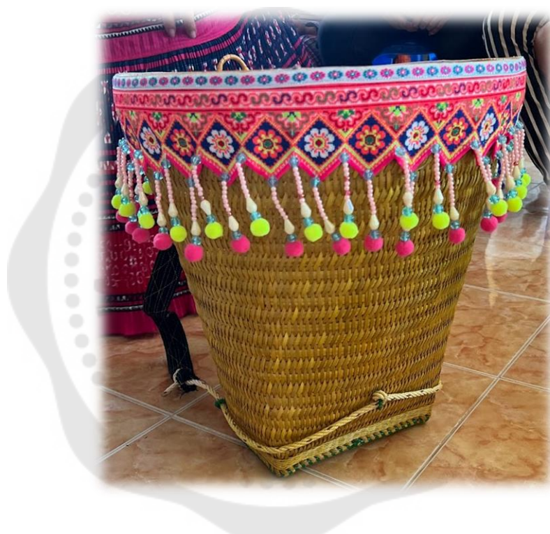
ภาพประกอบ 36 เป้ม้ง

เป้ม้ง (ก๋วย) เป็นเป้ที่มาจากภูมิปัญญาของชาวม้ง ในอดีตยังไม่มีถุงใส่ของ หรือภาชนะที่ใช้บรรจุของ ชาวม้งจึงได้ประดิษฐ์เป้โดยการสาน ซึ่งในอดีตใช้หวายในการสานแต่ ปัจจุบันชาวม้งหันมาใช้ไม้ไผ่เนื่องจากเป็นไม้ที่หาได้ง่ายภายในชุมชน และมีความคงทน แข็งแรง จะไม่มีขนาดที่เจาะจงอยู่ที่ผู้สานว่าอยากได้เป้ที่มีขนาดเท่าไร และตกแต่งเป้ให้สวยงามเป็น ขั้นตอนสุดท้าย โดยชาวม้งจะใช้เป้ในชีวิตประจำวัน ใช้ใส่สิ่งของต่าง ๆ เช่น ของที่ได้จากการ จับจ่ายตลาด ใส่อาหาร ใส่สัมภาระ เปรียบเสมือนกระเป๋าใบหนึ่งของชาวม้ง โดยจะมีแค่ผู้หญิงที่ สะพายเป้เท่านั้น