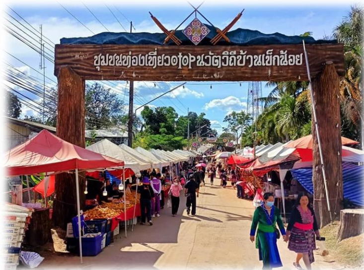
ภาพประกอบ 9 ประเพณีปีใหม่มัง

พื้นบ้าน เช่น การโยนลูกช่วง ระเบิดแป้ง เป็นต้น ประเพณีปีใหม่มังจะจัดขึ้นอย่างน้อย 3 - 9 วัน การแต่งกายของชาวมังที่มาร่วมงานจะได้ชุดมังลายผ้าปักหลากหลายสี