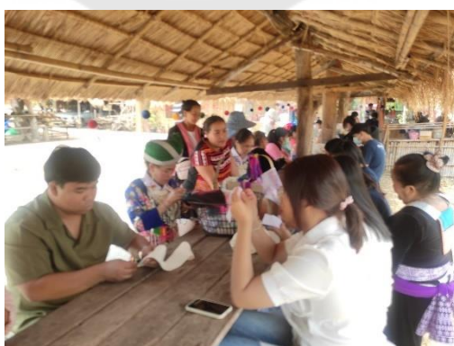
การทดลองจัดดำเนินกิจกรรมผ้าปักม้ง