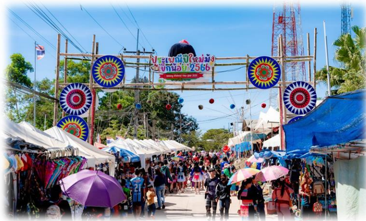
ภาพประกอบ 20 เทศกาลปีใหม่เมือง