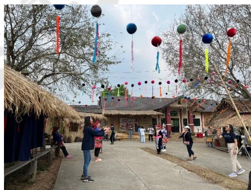
การทดลองจัดดำเนินกิจกรรมการเล่นแบบชาวม้ง