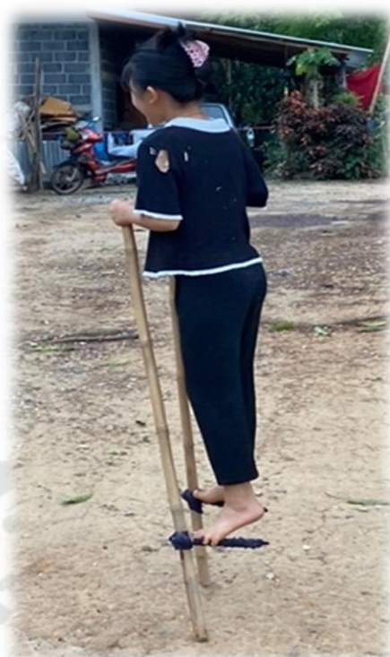
ภาพประกอบ 33 การเดินขาหยัง