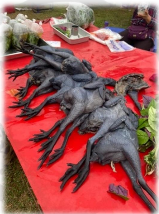
ภาพประกอบ 23 ไก่ดำบ้าน

เป็นเมนูที่ดัดแปลงมาจากการต้มยาสมุนไพรในสมัยโบราณ ชาวเมืองเชื่อว่าหากรับประทานไกต้มสมุนไพรจะช่วยในเรื่องการเพิ่มสมรรถของธาตุต่าง ๆ ในร่างกาย โดยการนำสมุนไพรที่มีแต่ในชุมชนเป็นวัตถุดิบหลักในการปรุงรส ประกอบด้วย 1. ว่านทองใบม่วง พญาบัวแดง (tsog nyuj liab) 2. ว่านใบเขียว พญาบัวเขียว (tsog nyuj ntsuab) 3. โสมจีนโบราณ (tshab xyoob) 4. จิงจู๋ช่าย (ko taw os) 5. สันพร้าวหอม (ntsej nrhua ntuag) 6. ผักเบ็ดแดง (nkaj qaib cheeb) 7. ผักแพวแดง (ib qaib liab) 8. ผักแพวลาย (ib qaib txaij) 9. พริกไทยดำบด (hwj txob) และ 10. ไก่ดำบ้าน นำมาต้มรวมกันแล้วจัดเสิร์ฟใส่ในภาชนะต่าง ๆ ให้สวยงาม