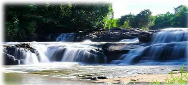
ภาพประกอบ 5 น้ำตกสันติสุข

ตั้งอยู่หมู่ที่ 1 บ้านห้วยน้ำขาว เป็นน้ำตกขนาดเล็ก มีน้ำตลอดปี มีชั้นเพียงชั้นเดียว แต่สามารถเดินชมต้นน้ำได้ยาวเพราะมีลักษณะเป็นรูปตัว Y แล้วไหลมารวมกัน โดยใช้เส้นทางเข็กน้อย - ห้วยน้ำขาว ระยะทางห่างจากบ้านเข็กน้อยประมาณ 11 กิโลเมตร