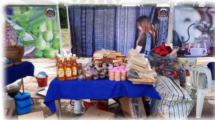
ภาพประกอบ 2 ของที่ระลึกประเภทผลิตภัณฑ์ทางการเกษตรชุมชนบ้านเข็กน้อย

5) ชุดและเครื่องแต่งกายท้องถิ่น ชุมชนบ้านเข็กน้อยมีชุดและเครื่องแต่งกายท้องถิ่นที่มีลักษณะเฉพาะของชุมชน ซึ่งอาจเป็นการแสดงอัตลักษณ์และวัฒนธรรมของชุมชนได้อย่างสมบูรณ์