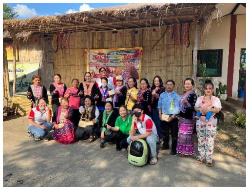
การจัดสนทนากลุ่มเพื่อเก็บข้อมูลการวิจัยระยะที่ 2.1 ในวันที่ 2 กุมภาพันธ์ พ.ศ. 2566