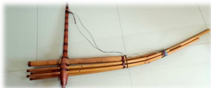
ภาพประกอบ 11 แคนม้ง (เกร็ง)

เป็นเครื่องดนตรีชนิดหนึ่ง ทำมาจากไม้ไผ่ การเป่าแคน (เกร็ง) สามารถเป่าได้ในหลายโอกาส เช่น งานมงคลสมรส และงานศพ ใช้ในการต้อนรับแขกบ้านแขกเมือง ซึ่งบทเพลงที่จะเป่าก็จะแตกต่างกันไป