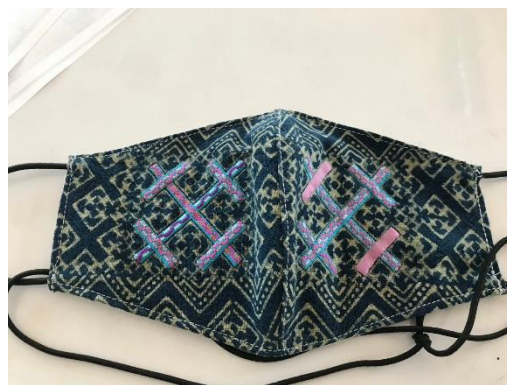
การพัฒนาผลิตภัณฑ์หน้ากากอนามัยผ้าเขียนเทียน