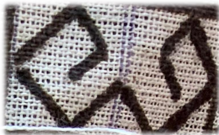
ภาพประกอบ 31 ลานกันหอย

ลายกันหอย (ก้ำก้อ) มีความเชื่อว่า เป็นลายที่แสดงถึงที่อยู่ของชาวม้งบนเขา แสดงถึงความเข้มแข็ง ความมั่นคง มีการกินดีอยู่ดี เป็นลายที่แสดงออกไปถึงจิตใจของม้งที่เข้มแข็งอดทนไม่ย่อท้อความยากลำบาก