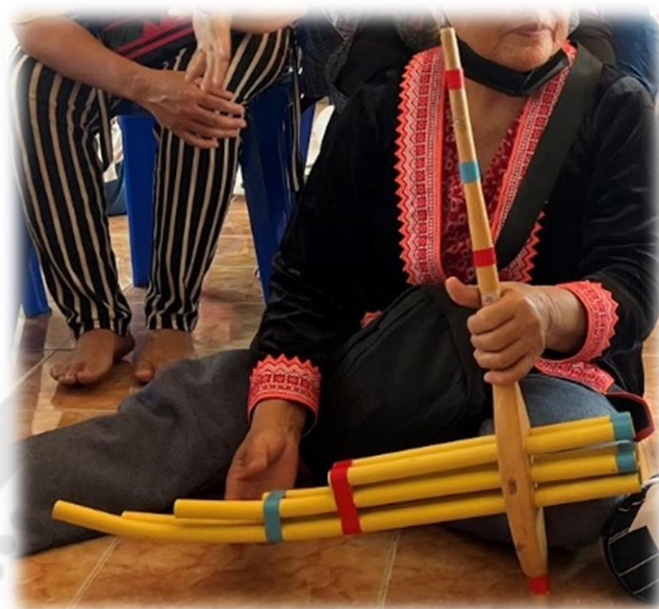
ภาพประกอบ 35 แคนม้ง

เด็กนักเรียนภายในชุมชนที่มีความสนใจในเรื่องของการเป่าแคน และมีการเป่าแคนโชว์ นักท่องเที่ยวในโอกาสต่าง ๆ เพื่อเป็นการเผยแพร่วัฒนธรรมของชาวม้ง