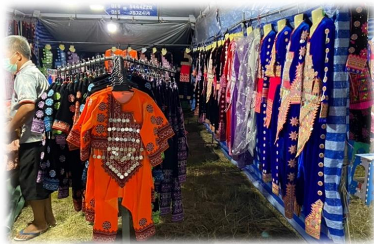
ภาพประกอบ 22 การจำหน่ายชุดประจำชาติม้ง