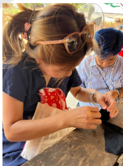
การทดลองจัดดำเนินกิจกรรมทำลูกช่ວง DIY