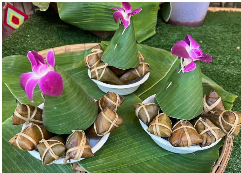
ภาพประกอบ 10 ข้าวห่อกะเหรียง