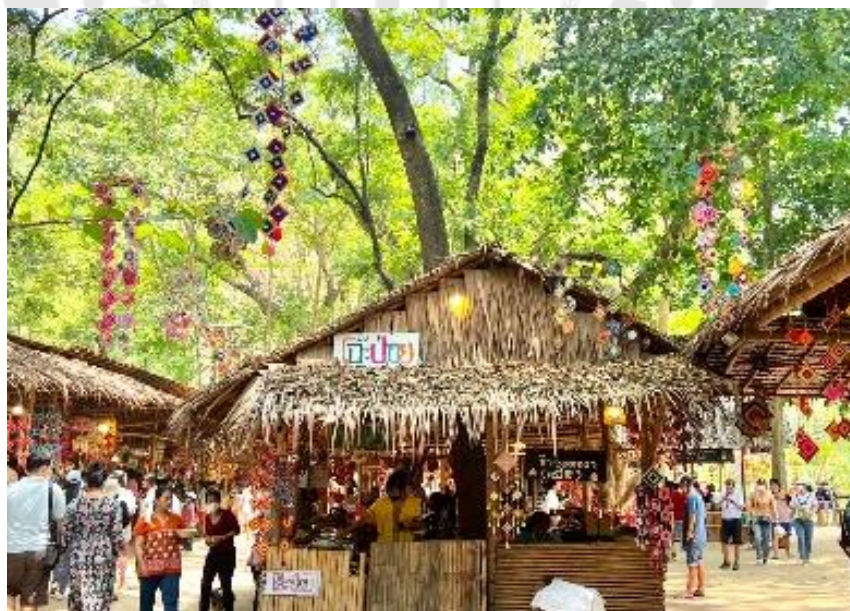
ภาพประกอบ 12 บรรยากาศร้านค้าภายในตลาดวิถีชุมชนโ๊ะปอย