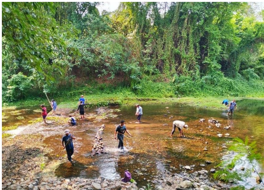
ภาพประกอบ 22 ปรับปรุงทัศนวิสัย และเก็บขยะบริเวณลำธาร