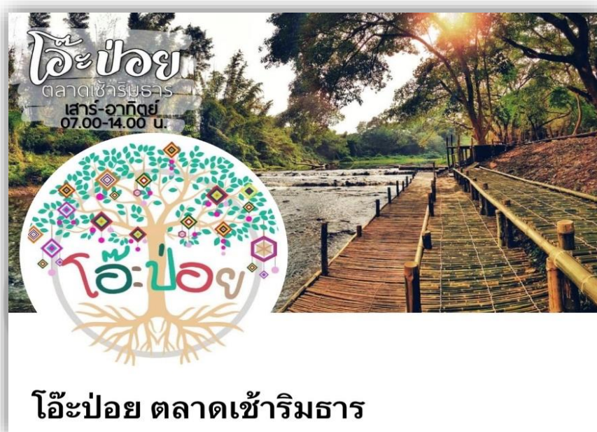
ภาพประกอบ 20 เพจเฟซบุ๊ก "โอ๊ะป่อย ตลาดเช้าริมธาร"

4. ด้านการประชาสัมพันธ์ ตลาดวิถีชุมชนโอ๊ะป่อยมีช่องทางในการประชาสัมพันธ์ผ่านเพจเฟซบุ๊ก "โอ๊ะป่อย ตลาดเช้าริมธาร" ซึ่งเป็นช่องทางหลักในการให้ข้อมูลข่าวสาร รูปภาพกิจกรรม และช่วงวันเวลาเปิด-ปิดตลาด นอกจากนี้ยังมีช่องทาง Line Official ของตลาด ซึ่งจะเป็น 2 ช่องทางหลักในการตอบคำถามและให้ข้อมูลแก่ผู้ที่สนใจและบุคคลทั่วไป