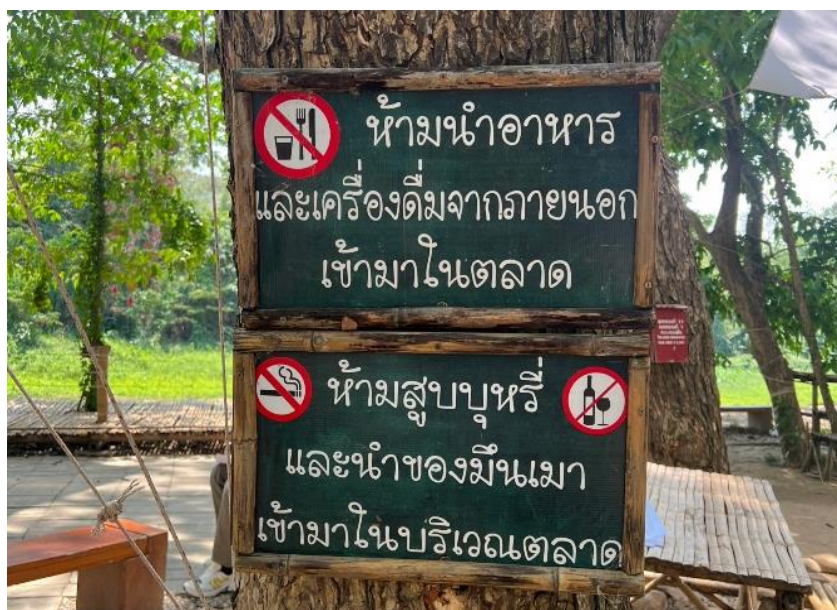
ภาพประกอบ 25 บ้ายสื่อความหมายตามจุดต่าง ๆ