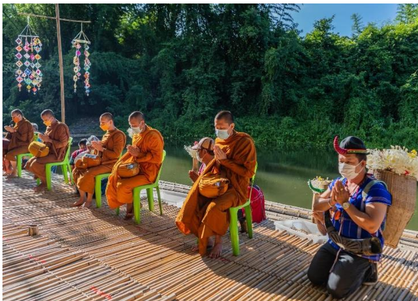
ภาพประกอบ 5 การตักบาตรพระล่องแพ