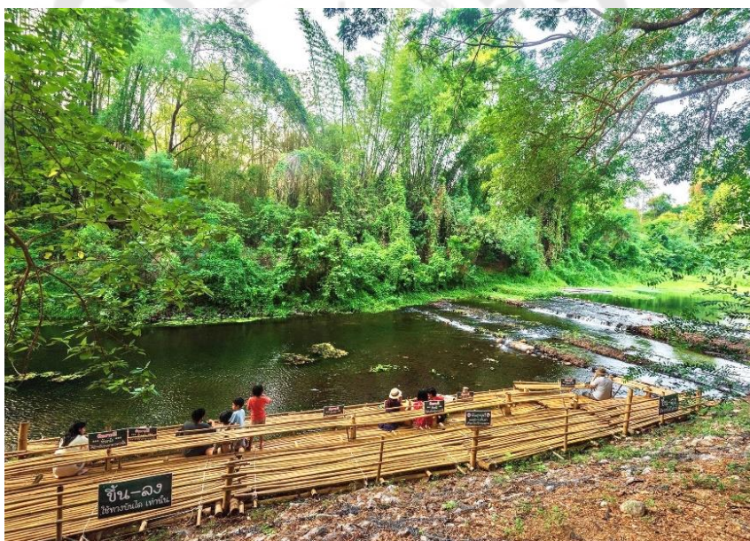
ภาพประกอบ 19 แคร่ที่นั่งไม้ไผ่ริมแม่น้ำลำภาชี