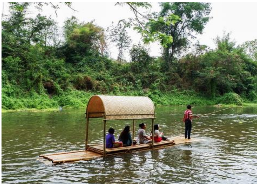
ภาพประกอบ 7 การล่องแพไม้ไผ่