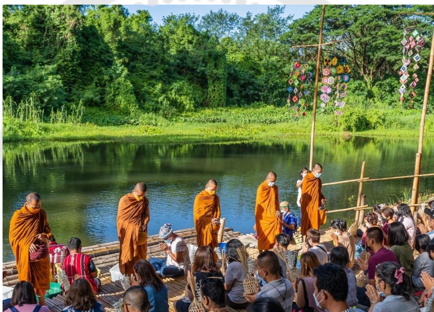
ภาพประกอบ 21 บริเวณลานทำกิจกรรมตักบาตรพระล่องแพ

การพัฒนากิจกรรมท่องเที่ยวภายในตลาดได้เผยแพร่ศิลปวัฒนธรรม ส่งเสริมให้ผู้ที่มาเยี่ยมชมเกิดการรับรู้ถึงวิถีการดำรงชีวิตของกลุ่มชาติพันธุ์กะเหรี่ยง แต่อย่างไรก็ตาม จากจำนวนผู้ที่เดินทางมาเยี่ยมชมตลาดวิถีชุมชนไฉะปอยมีจำนวนมาก อาจกระทบต่อการเปลี่ยนแปลงค่านิยมของสังคมท้องถิ่น และรบกวนต่อชีวิตความเป็นอยู่ที่ยั่งยืนของชุมชนหรือชุมชนใกล้เคียง