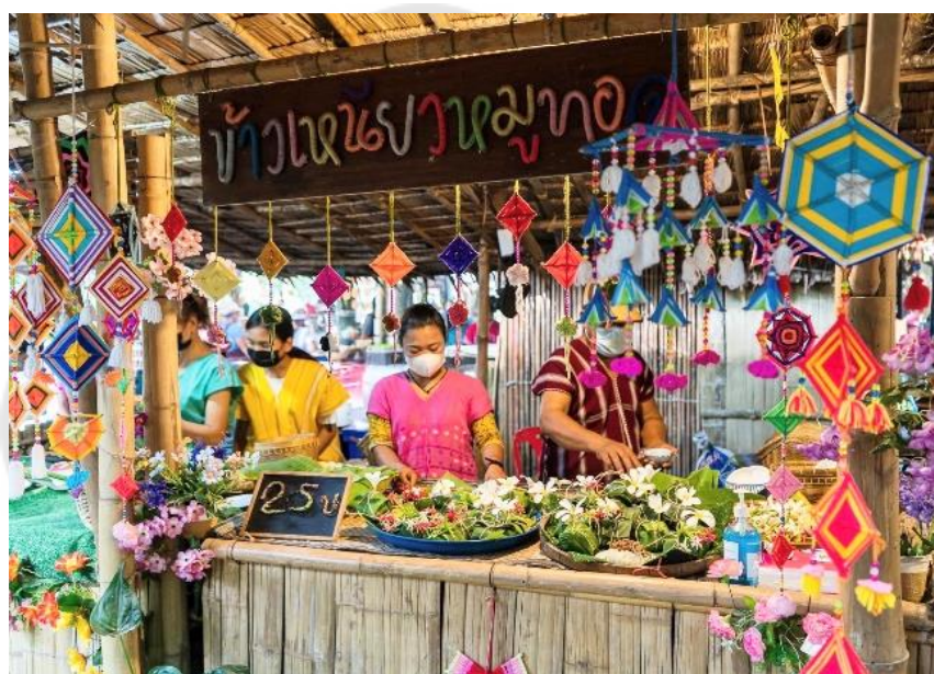
ภาพประกอบ 14 ร้านค้าภายในตลาดวิถีชุมชนไฉะปอย

“...เราขายสินค้าในราคาเยอเมอร์ ไม่แพง เพราะตั้งใจจะให้นักท่องเที่ยวได้ทานอาหารมากกว่า 1 อย่าง และได้ชิมอาหารหลาย ๆ อย่าง กฎของเราคือมีอยู่ว่าสินค้าต้องห้ามหมดก่อนบ่าย 2 โมง เพราะนักท่องเที่ยวเดินทางมาไกลจะต้องได้ทานอาหาร และสินค้าไม่ดีอย่าขายคุณภาพไม่ถึงอย่าขาย...” (ตัวแทนผู้ประกอบการ, การสื่อสารส่วนบุคคล, 6 มีนาคม 2566)