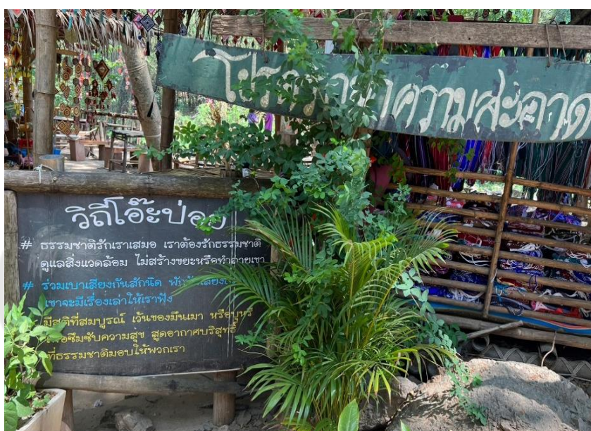
ภาพประกอบ 24 ป้ายรณรงค์รักษาสิ่งแวดล้อมในตลาด

มีugdคำของตนเอง เพื่อให้บริการกับผู้ที่มาในการรับชยะจากทุกคน โดยไม่แบ่งว่าชื้อจากร้านไหน มีการติดป้ายสื่อความหมายและป้ายสื่อสารรณรงค์รักษาสิ่งแวดล้อมเพื่อสร้างการตระหนักรู้ อีกทั้งยังมีหน่วยงานจากภาครัฐ และภาคเอกชน ได้นำป้ายประชาสัมพันธ์ มาสื่อสารและบอกเล่าเรื่องราวทางวัฒนธรรมภายในตลาด เช่น การบอกเล่ากิจกรรมการตักบาตรพระล่องแพ และป้ายสื่อสารบอกเล่าเกี่ยวกับลายผ้าทอกระเหรี่ยง เป็นต้น เพื่อส่งเสริมการเรียนรู้และปลูกฝังจิตสำนึกในการรักษาธรรมชาติให้เกิดความยั่งยืนและเป็นมิตรกับสิ่งแวดล้อมต่อไป