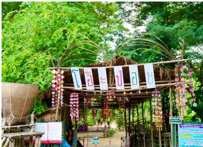
ภาพประกอบ 4 ตลาดวิถีชุมชนไ้อะปอย