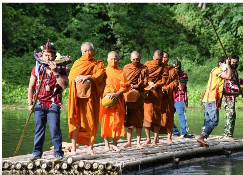
ภาพประกอบ 17 การถ่อแพไม้ไผ่ ในกิจกรรม “การตักบาตรล่องแพ”

“...วิถีชีวิตดั้งเดิมของชาวสมัยก่อนนิยมเดินทางสัญจรทางน้ำ จึงได้นำแพมาใช้ เพื่อให้พระสงฆ์ได้ออกมาบิณฑบาตในยามเช้า...” (ตัวแทนคณะทำงาน, การสื่อสารส่วนบุคคล, 6 มีนาคม 2566)