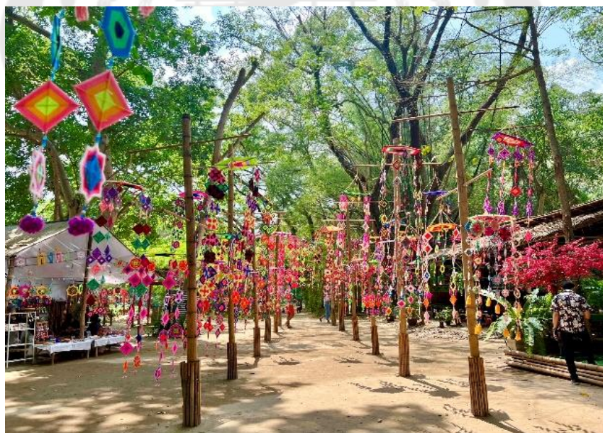
ภาพประกอบ 18 ลานคังคัง

“...ความตั้งใจเล็ก ๆ ในการเปิดตลาดวิถีชุมชนโฉะป๋อย ต้องการจะแสดงถึงอัตลักษณ์ ประเพณีวัฒนธรรมของชุมชนชาวกะเหรี่ยง ผ่านสัญลักษณ์ต่าง ๆ การแต่งกายด้วยผ้าทอกะเหรี่ยงและสิ่งยึดเหนี่ยวจิตใจ เช่น การนำคังคังหรือใยแมงมุม สัญลักษณ์ตามความเชื่อของชาวกะเหรี่ยงที่ใช้ในประเพณีซึ่งทะเล็งมาตกแต่งภายในตลาดให้เกิดเป็นภาพจำ เพื่อการบอกเล่าเรื่องราวและเพื่อถ่ายทอดให้คนที่มาเที่ยวเกิดการรับรู้ไม่มากก็น้อย และที่สำคัญที่สุด ต้องการให้ความเป็นชาวกะเหรี่ยงดั้งเดิมที่จะสูญหายหรือลบล้างเลือนไปกลับมามีชีวิตชีวาอีกครั้งหนึ่ง...” (ผู้ใหญ่บ้านหมู่ 2, การสื่อสารส่วนบุคคล, 6 มีนาคม 2566)