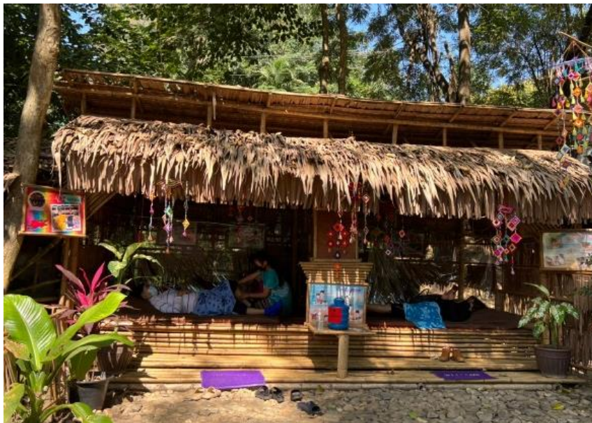
ภาพประกอบ 6 การนวดแผนไทย