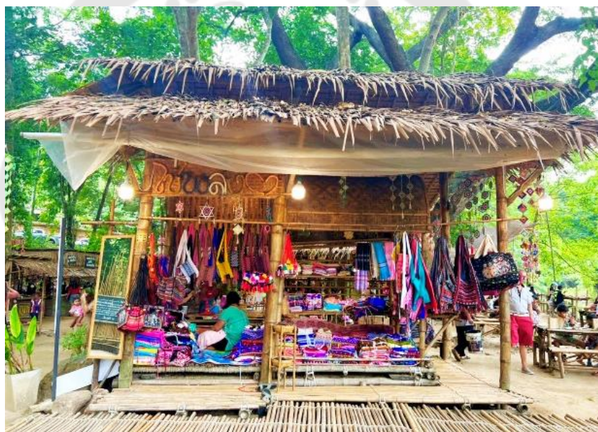
ภาพประกอบ 13 ร้านค้าภายในตลาดวิถีชุมชนไช้ป้อย

ในด้านการจำหน่ายสินค้าภายในตลาดวิถีชุมชนไช้ป้อย มีกลยุทธ์ในการมุ่งขายประสบการณ์ให้กับนักท่องเที่ยว โดยมีองค์ประกอบหลัก ๆ ในการจำหน่ายสินค้า คือ ฟังก์ชัน (Function) และ อารมณ์ (Emotion) คือ การมุ่งเน้นจำหน่ายสินค้าให้เกิดความน่าสนใจและมีศักยภาพที่เพียงพอ โดยเริ่มจากการพัฒนา ปรับภาพลักษณ์และรสชาติของอาหาร ปรับผลิตภัณฑ์ให้เข้ากับชุมชน มีการนำเสนอกรรมวิธีในการประกอบอาหารและของหวาน โดยใช้ทรัพยากรท้องถิ่นของชุมชน ดึงดูดให้ผู้ที่มาเยี่ยมชมได้สัมผัสและลิ้มลอง นอกจากนี้ยังได้นำวัฒนธรรมองค์กรมมาปรับใช้กับตลาดวิถีชุมชนไช้ป้อย โดยทุกร้านค้าจะต้องพร้อมพัฒนา ปรับปรุง ต่อยอด และช่วยเหลือซึ่งกันและกัน เพื่อสร้างโมเดลรายได้ควบคู่กับการพัฒนาชุมชน พัฒนาสิ่งแวดล้อมและวัฒนธรรมชุมชน