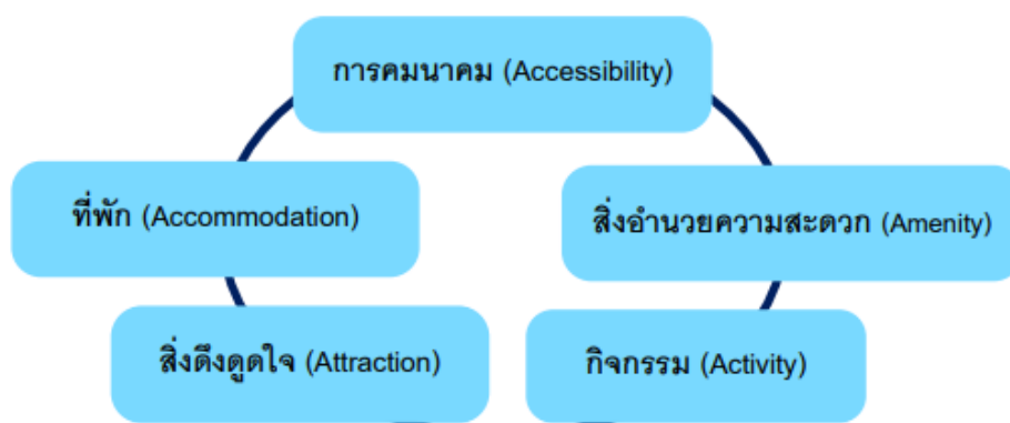
ภาพประกอบ 2 องค์ประกอบของแหล่งท่องเที่ยว

เทิดชาย ช่วยบำรุง (2552) กล่าวไว้ว่า องค์ประกอบของแหล่งท่องเที่ยว มีทรัพยากรสำคัญ 5 ประการ หรือ 5A's ดังนี้