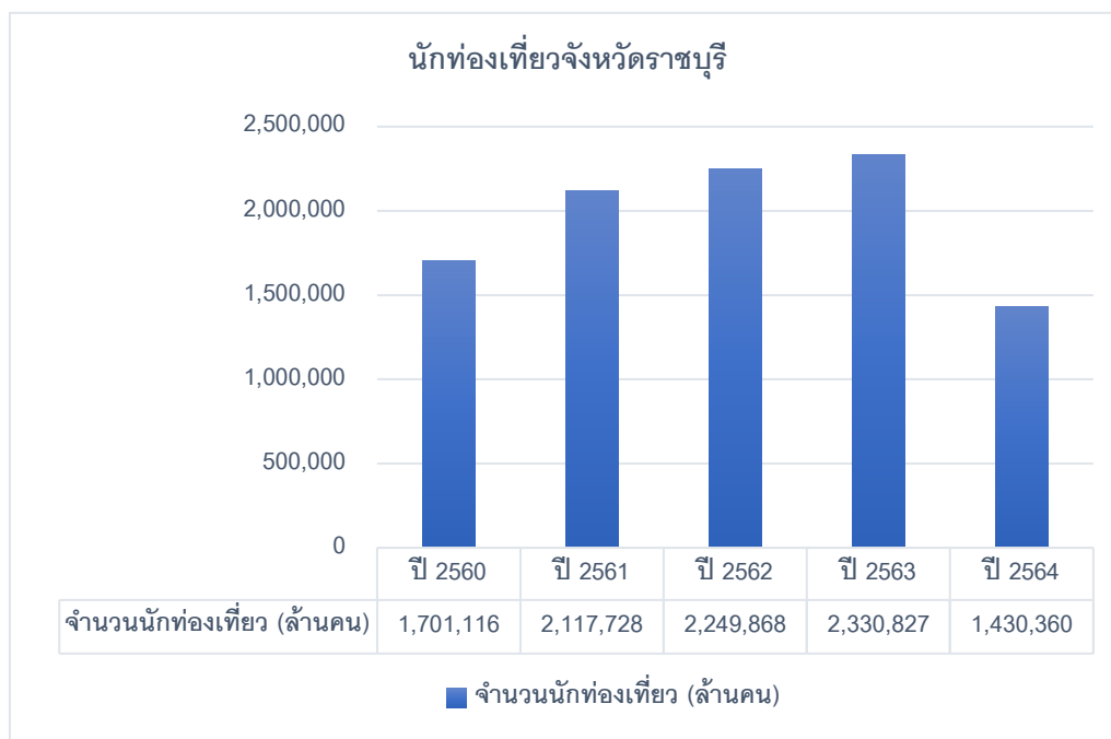
ตาราง 1 แสดงจำนวนนักท่องเที่ยว จังหวัดราชบุรี