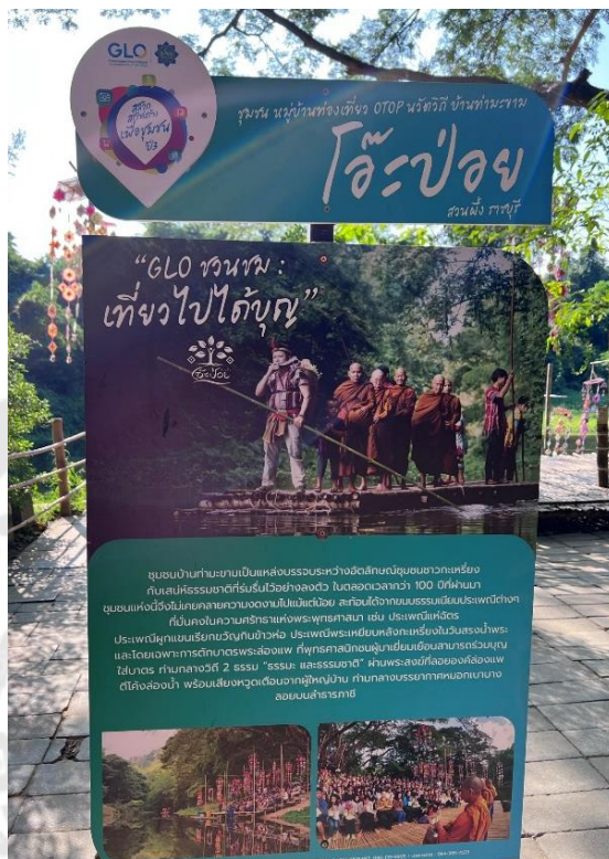
ภาพประกอบ 23 ป้ายประชาสัมพันธ์แหล่งท่องเที่ยว

เพื่อส่งเสริมการจัดการขยะมูลฝอยในพื้นที่ อีกทั้งมหาลัษราชภัฏบ้านจอมบึงยังได้ทำการส่งเสริมการเรียนรู้ให้กับคนในพื้นที่