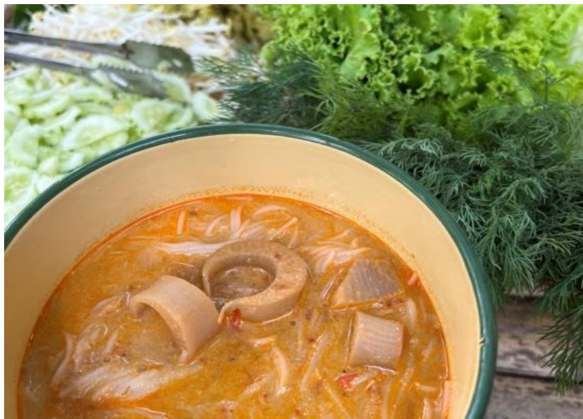
ภาพประกอบ 11 ขนมจีนน้ำยาหยวกกล้วย