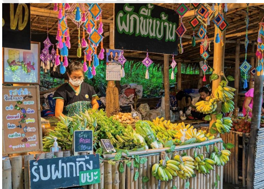
ภาพประกอบ 15 ร้านค้าผักพื้นบ้าน

“...กิมมิคของเรา คือ ราคาถูก อาหารอร่อย ดี ได้มาตรฐานของตลาด มุ่งในการเป็นตลาดที่ได้มาตรฐาน...” (ตัวแทนคณะทำงาน, การสื่อสารส่วนบุคคล, 6 มีนาคม 2566)