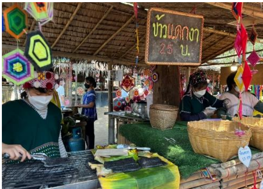
ภาพประกอบ 8 ข้าวแดกงา