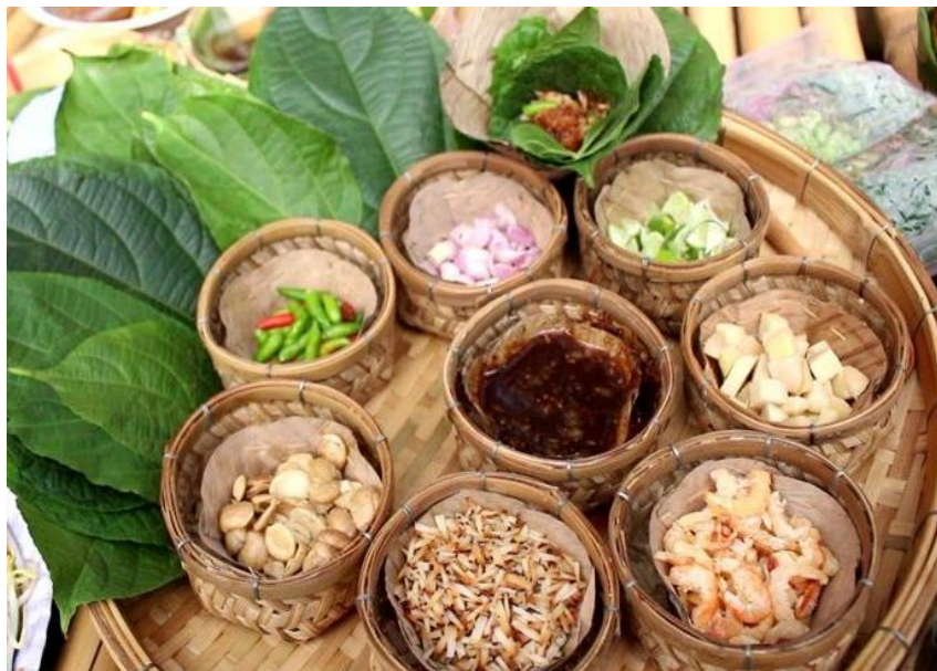
ภาพประกอบ 9 เมี่ยงคำถั่วดาวอินคา