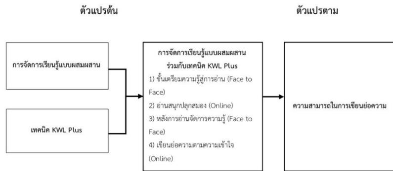
ภาพประกอบ 1 กรอบแนวคิดที่ใช้ในการวิจัย