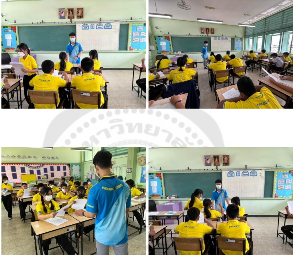
ปฐมนิเทศและทำแบบทดสอบก่อนเรียน