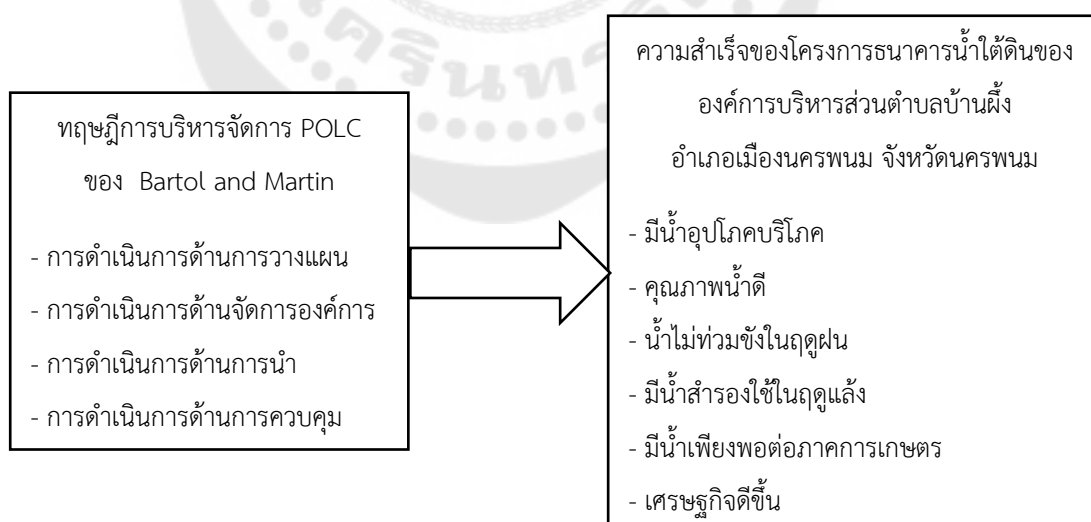
ภาพประกอบ 1 กรอบแนวคิดที่ใช้ในการศึกษา

การศึกษานี้จะใช้กรอบแนวคิดที่อยู่ภายใต้แนวคิดและกรอบการบริหารจัดการ 4 ด้าน (POLC) ของ บาร์โธล และ มาร์ติน (Bartol และ Martin, 1998) ที่มี การวางแผน (Planning) การจัดองค์การ (Organizing) การนำ (Leading) และการควบคุม (Controlling) เป็นองค์ประกอบในแนวคิดดังกล่าว