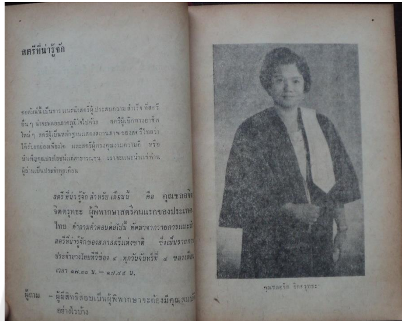
ภาพประกอบ 3 คุณชวลอจิตต์ จิตตรุทธะ ผู้พิพากษาศรีคนแรกแห่งประเทศไทย