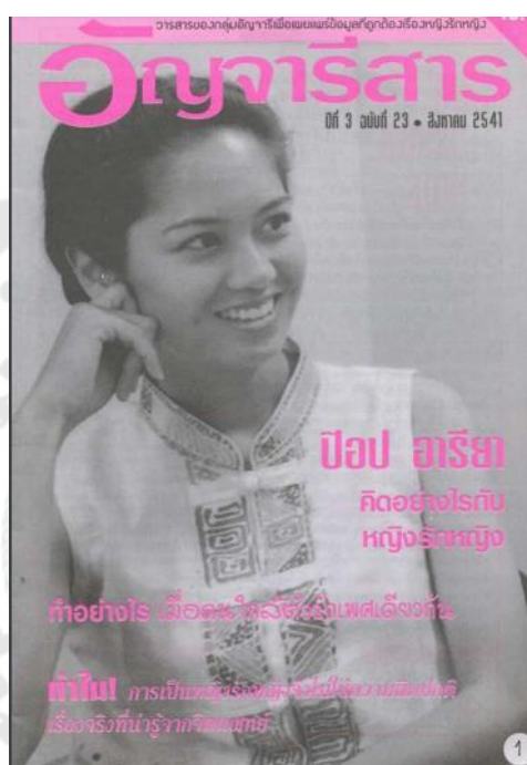
ภาพประกอบ 5 หน้าปกวารสารอังจารีสาร

หญิงได้รับความสนใจอย่างมากในวงวิชาการทั้งถูกหยิบยกขึ้นเป็นหัวข้อสนทนาในงานเสวนาและมีบรรดานิสิตนักศึกษาให้ความสนใจนำไปใช้เป็นหัวข้อสำหรับทำวิจัยเป็นจำนวนมาก ส่วนผลที่ได้รับจากการเคลื่อนไหวในเรื่องดังกล่าว คือ ทัศนคติของผู้คนในสังคมที่มีต่อกลุ่มหญิงรักหญิงเปลี่ยนแปลงไปในหลายทิศทาง รวมถึงความเข้มงวดในตัวกรอบและจารีตของสังคมต่อบุคคลกลุ่มนี้ก็ผ่อนคลายลงอย่างเห็นได้ชัด 175