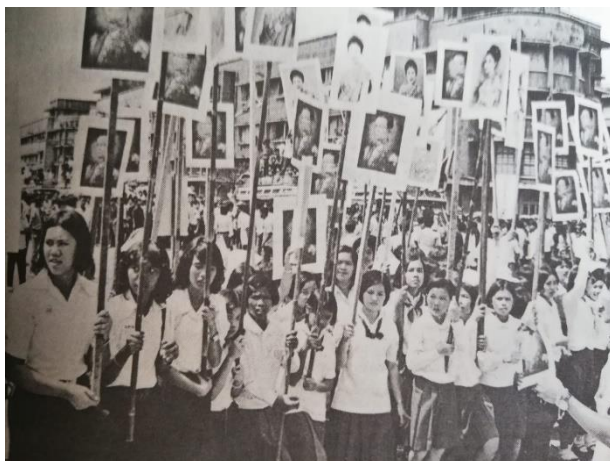
ภาพประกอบ 2 การเดินขบวนของนักศึกษาและประชาชนในเหตุการณ์ 14 ตุลาคม 2516

ที่มา: มณฑล ไบบัว (เมธีวงศ์) และ จิระนันท์ พิตรปรีชา. (2556). หุดเข็มนาฬิกา. หน้า